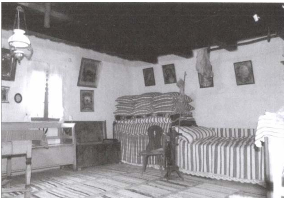
Tájház a Székelyudvarhely melletti Máréfalván

de közjogi – kisebbségben él a magyarság, ezek a „tájházak” közművelődési és tudományos szerepük mellett a nemzeti identitásnak, megmaradásnak is fontos örhelyei.