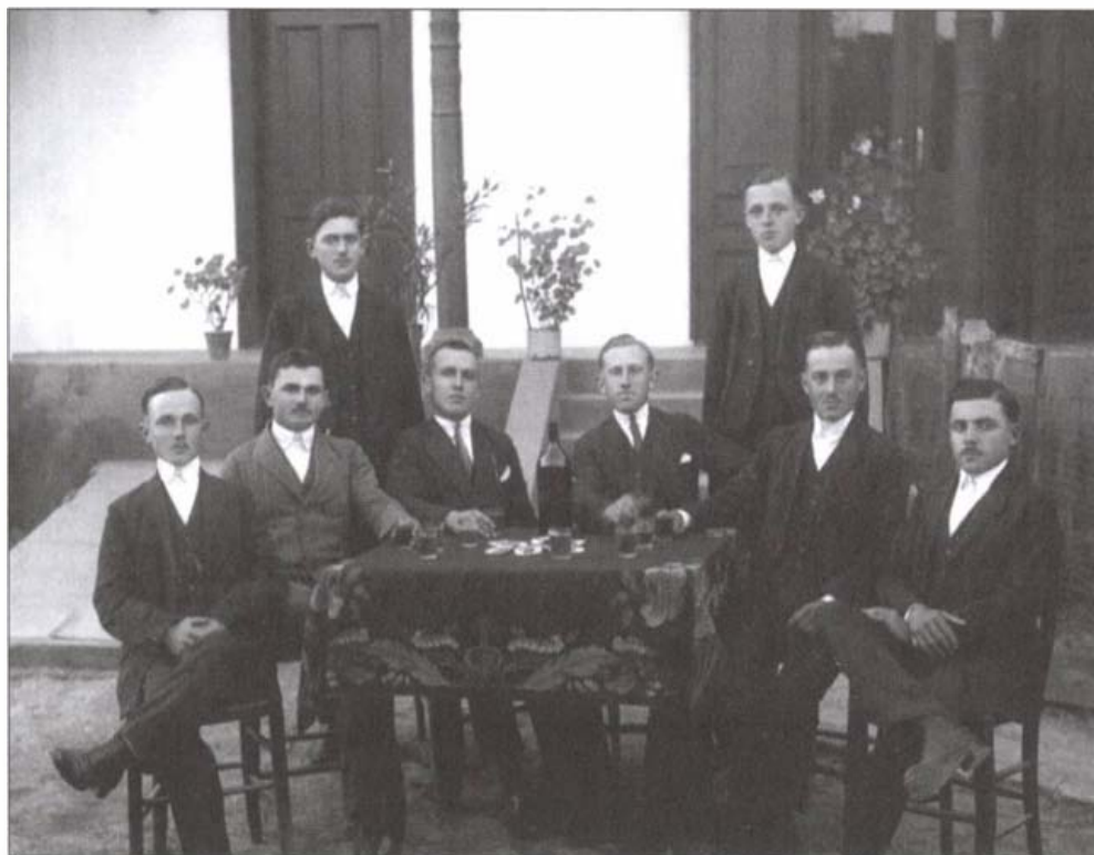
Legénybanda az 1930-as években

Minden banda életének jelentős eseménye volt a szüreti bál. A házasodáshoz korban legközelebb álló banda joga volt a szüreti mulatság megrendezése, de volt olyan év, hogy három banda is rendezett szüreti bált. Maguk közül választottak bírót, bírónét, jegyzőt, jegyzőnét. A legények bandabeli lányokat hívtak csöszlányoknak. Megmutatták magukat az egész falunak, a bál bevételével maguk gazdálkodtak.