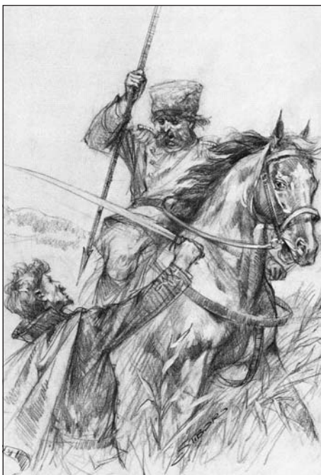
Petőfi halála (Silberhorn Tibor rajza)

Ma már én is tudom, hogy ő volt a legnagyobb magyar költő, verseit én is olvasom, te is tanuld meg mind, ami csak a kezébe kerül – javasolta unokájának.