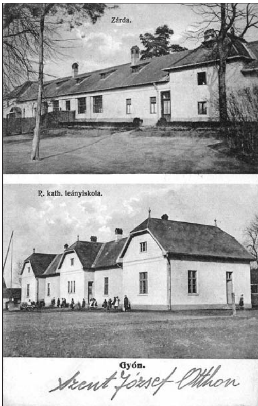
A zárda és a gyermekotthon az 1930-as években, korabeli levelezőlap

ország első hadiárvaházát 100 keresztes nővér, majd a szegedi iskolanővérek szociális otthonává alakították, míg a tantermek néhány évig a helyi általános iskola oktatási feladatait segítették. Az otthon egyházi fenntartásban működött, majd 1980-ban a Pest Megyei Tanács vette át és fokozatosan világi szociális otthonná formálták. A Római Katolikus Egyházi Szeretetszolgálat 1992 januárjában visszakarta az otthont, melyben azóta ökumenikus jelleggel a Zárdakert Idősek Otthona működik.