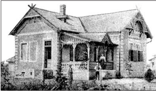
A Baranyai-villa, Bartók Béla szálláshelye 1906. augusztus végén (Kamarási út 47.)

tő vetélytársa, és a „csodahegedűssel”, a még gyermek Vecsey Ferivel (1893–1935) ekkor tért haza Spanyolországi hangversenykörútról, most pedig „népdalgyűjtési körúton” van: az országot bejárva kutat „oly magyar nóták után”, amelyek „tősgyökeres magyar jellegűek”, és nyomtatásban eddig nem jelentek meg. Ez a laikus fogalmazás hű tükrö a népdalról, a népzeneről a XX. század elején általános ismereteknek, fogalmaknak. A tudósító összekeverte Kamaráserdőt Paliccsal, azt állítva, hogy Bartók innen jött Szegedre. De fontos és hiteles, amit ezután közölt: „kutatásait Bauer tanárjelölt társaságában Alsóvároson kezdte meg. Egy érdekes Rózsa Sándor-balladát itt már talált is. Bartók, akinek kutatói munkásságában Szegeden a helybeli zeneiskola kiváló igazgatója, König Péter is segítkezik, holnap Horgoson folytatja tanulmányútját.”