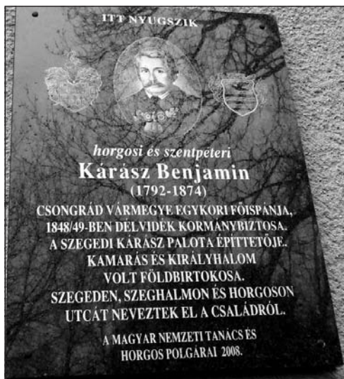
Kárász Benjámín horgosi emléktáblája

Unokája, Kárász Benjámín (1792–1874) a szabadságharc szegedi hőse lett. Jóvátette, elfeledtette nagyapja gyarlóságait. Csongrád megye főispánja, a Kárász utca névadója: a sarkán álló Kárász-ház építtetője (1845). Kossuth Lajos ennek erkélyéről mondta el 1849. július 11-én e hazában utolsó nyilvános beszédét. A szabadságharc bukása után Kárász Benő Kamarásra húzódott vissza, itt gazdálkodott. A horgosi templom kriptájában nyugszik. Tán legjelentősebb tette volt, hogy 1857-ben mintegy nyolcvan holdon erdőt telepített. Kamaráspusztá igy lett Kamaráserdő. 1864-ben fölépült a szegedi–szabadkai vasútvonal, s ez megkönnyítette az addig szórványos villák megközelítését, meggyorsította a gazdagodást, bővülést.