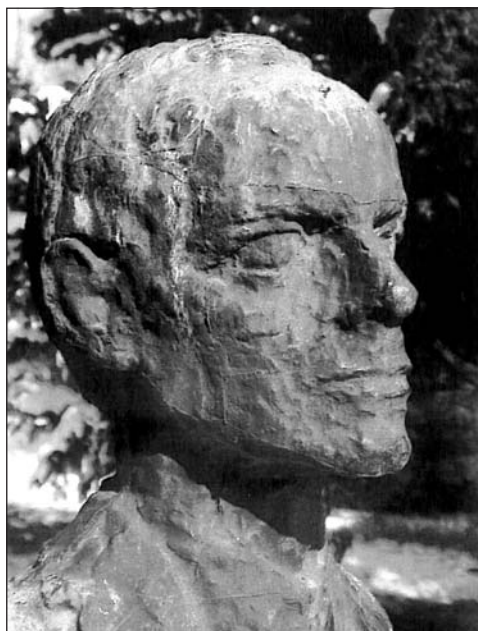
A mohácsi Bartók-szobor

A hidasi Bartók-szobor alkotója Szöllőssy Enikő szobrász- és éremművész. Az alkotás a fiatal Bartókot ábrázolja egyedi szobrászati kifejezőmóddal. A szobrot a Baranya megye zenei életét irányító szakfelügyelői testület ajándékként kapta a Művelődésügyi Minisztériumtól, melyet továbbajándékozott Hidás településnek, ahol megkülönböztetett törődéssel ápolják Bartók emlékét. A bronz mellszobor avatására, Bartók Béla születésének 85. születési évfordulóján, 1966. szeptember 5-én került sor. Ezen helyi előadók és dunaiújvárosi zenetanárok szerepeltek, valamint a szomszédos Tolna megyei város, Bonyhád Erkel-kórusa lépett fel.