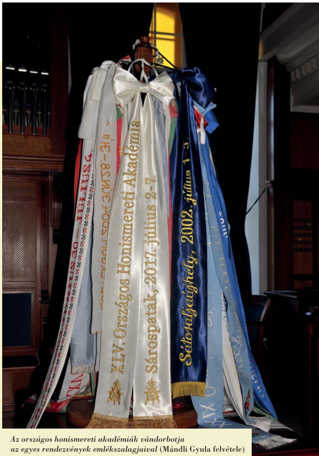
Az országos honismereti akadémiák vándorbotja az egyes rendezvények emlékszalagjaival