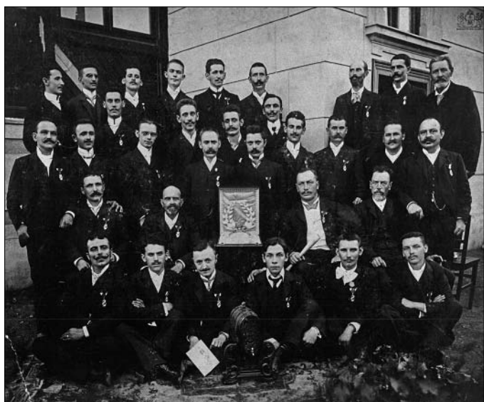
A Typographia Dalkör 1903-ban

A választmány évi jelentésének közgyűlés elé való terjesztése, a napirend előterjesztése 1887-ig magyar és német nyelven történt, mint ahogy két nyelven írták a jegyzőkönyveket is. Az 1887. május 8-án tartott közgyűlésen a választmány évi jelentését már csak magyarul olvasták fel. Az elnök kérdésére, mely szerint van-e valaki, aki a magyar nyelven fölolvastott évi jelentést nem értette meg, és hogy szükséges-e azt német nyelven is fölolvasni, a közgyűlés kijelentette, hogy megértette, és a német nyelven történő fölolvastást nem kívánja. 15