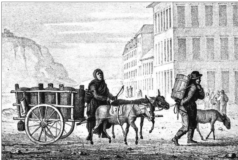
„Dunavizes”-ek vizesputtonyokkal (Az Ország Tükre 1864. 113.)