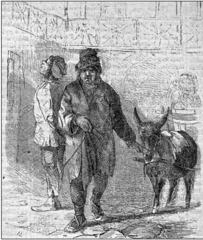
„Dunavizes” és szolgája (Vasárnapi Ujság 1865. 53.)