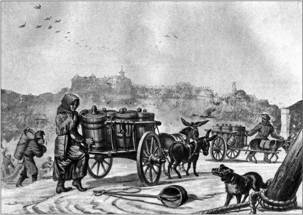
„Dunaviz hordogató” a pesti parton, Szterio Károly akvarellje (Prónay Gábor 1855. Oldalszámozás nélkül)

állandó megrendelőikhez, ahova reggel is, délután is – tehát napjában kétszer – kellett vizet vinni. Egy nap négyszer-ötször fordultak. Állandó megrendelőik ellátása után házról házra járva hangos „Donauwasser!”, utóbb pedig „Duna-vizet!” kiáltással igyekezett felhívni magára a figyelmet. Ha vevőre talált, a puttonyt a hátára kapva maga vagy a segédje vitte föl a vizet a konyhába, s az erre a célra szolgáló tárolóedénybe öntötte. Egy puttony vizet három krajcárért árult, azonban a tarifa az emeletek számával és a Dunától való távolsággal arányosan emelkedett. Általában emeletenként egy krajcárt kértek.