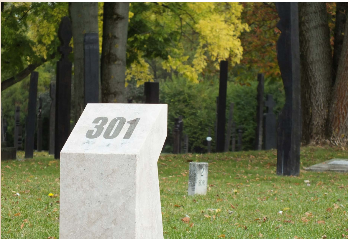
A 301-es parcellát jelölő emlékkő.