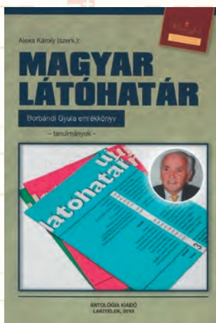
Alexa Károly (szerk.): Magyar Látóhatár. Borbándi Gyula emlékkönyv. Tanulmányok