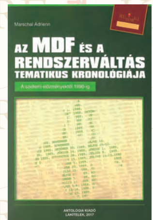
Marschal Adrienn: Az MDF és a rendszerváltás tematikus kronológiája