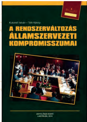
Kukorelli István-Tóth Károly: A rendszerváltozás államszervezeti kompromisszumai