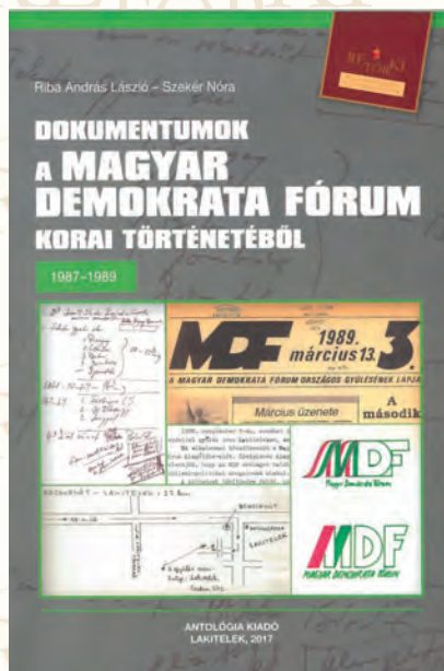
Riba András – Székér Nóra: Dokumentumok az MDF korai történetéből