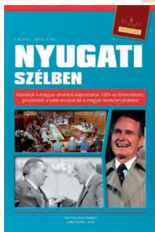
Kávássy János: Nyugati szélben. Adalékok a magyar-amerikai kapcsolatok 1989-es történetéhez; gondolatok a kelet-európai és a magyar rendszerváltáshoz