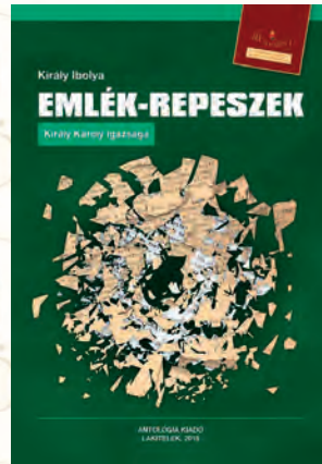
Király Ibolya: Emlék-repeszek. Király Károly igazsága