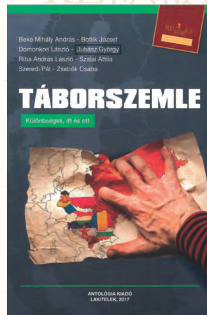
Juhász György: Táborszemle

További információk a RETÖRKI Könyvek eddig megjelent kötetekének elérhetőségéről az alábbi helyen: http://www.retorki.hu/rovat/elerhetoseg#boltok