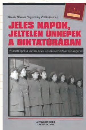
Szekér Nóra-Nagymihály Zoltán (szerkk.): Jeles napok, jeltelességek a diktatúrában. Pillanatképek a kommunista emlékeztetpolitika valóságából