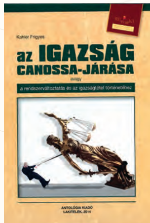
Kahler Frigyes: Az Igazság Canossa-járása avagy a rendszerváltatás és az igazságtétel történetéhez