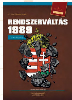
M. Kiss Sándor (szerk.): Rendszerváltás 1989, 15 tanulmány