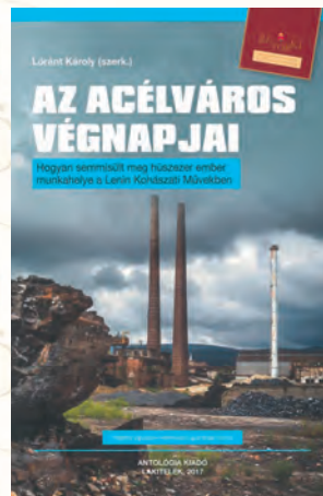
Lőrinc Károly (szerk.): Az Acélváros végnapjai