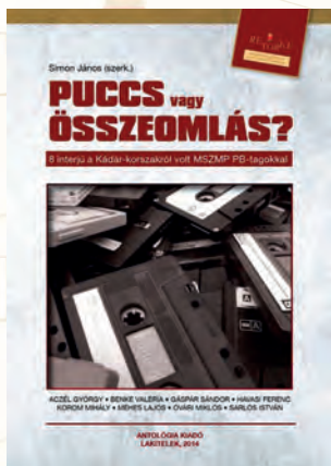
Simon János: Puccs vagy összeomlás? 8 interjú a Kádár-korszakról volt MSZMP PB-tagokkal