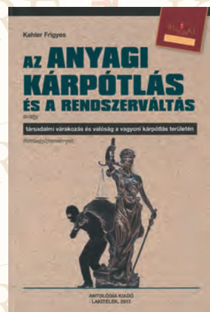
Kahler Frigyes: Az anyagi kárpótlás és a rendszerváltás