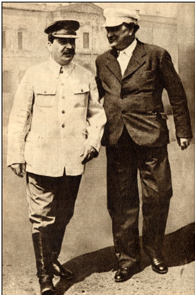
Sztálin és Dimitrov 1936-ban, Moszkvában. Dimitrov, a Komintern vezetője végezte el a kommunista népfrontpolitika elméleti megalapozását.

leghatározottabban visszautasítottak volna: a két tulajdonságjegy a „nemzeti” és a „demokrata” volt. Mindenekelőtt a németellenes csoportokkal való együttműködést gátló, az osztályharcot előtérbe állító „osztály az osztály ellen” alapelv vált feleslegessé. Nem csodálkozhatunk ezen, hiszen az már elméletileg kizárta „elnyomók” és „elnyomottak”, vagyis a polgárság vagy más társadalmi osztályok, valamint a munkásság átfogó nemzeti érdekek mentén történő együttműködését. A Komintern VII. kongresszusán a szekciók elejtették az „osztály az osztály ellen” jelszavát, és óvatosan elkezdtek a „nemzeti összefogás” az osztályharc gondolatától oly idegen fogalmát a kommunista propaganda és agitáció részévé tenni. Ennek elméleti megalapozását a Komintern vezetője, Georgi Dimitrov végezte el. A Komintern első embere kongresszusi beszédében kitért arra, hogy a kommunisták bár nem fogadják el a „burzsoá nacionalizmust”, de a „nemzeti nihilizmus” is idegen tőlük.