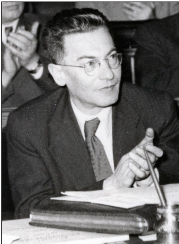
Révai József az Országházban, 1950. december 8-án.

optimizmusának és haladáshitének, hiszen nem is igazi pesszimizmus, hanem a „magyar haladás sorsa fölötti gyöt-rődés”, a „haladó magyar lázongása” a társadalmi viszonyokkal szemben. 17 A fenti példák szemléltetik, hogy a nemzeti múlt és művelődés nagyjai a „haladó hagyományok” részévé válva az éppen aktuális kommunista politikai program és az annak elméleti igazolást adó ideológia üzeneteinek szimbólumalakjaivá torzultak. Ezért fogalmazhatunk úgy, hogy az általunk vizsgálandó hagyomány-politikai írások egyik alapvető funkciója az ideológiaközvetítés – a múlt, a nemzeti hagyományok közegét felhasználva.