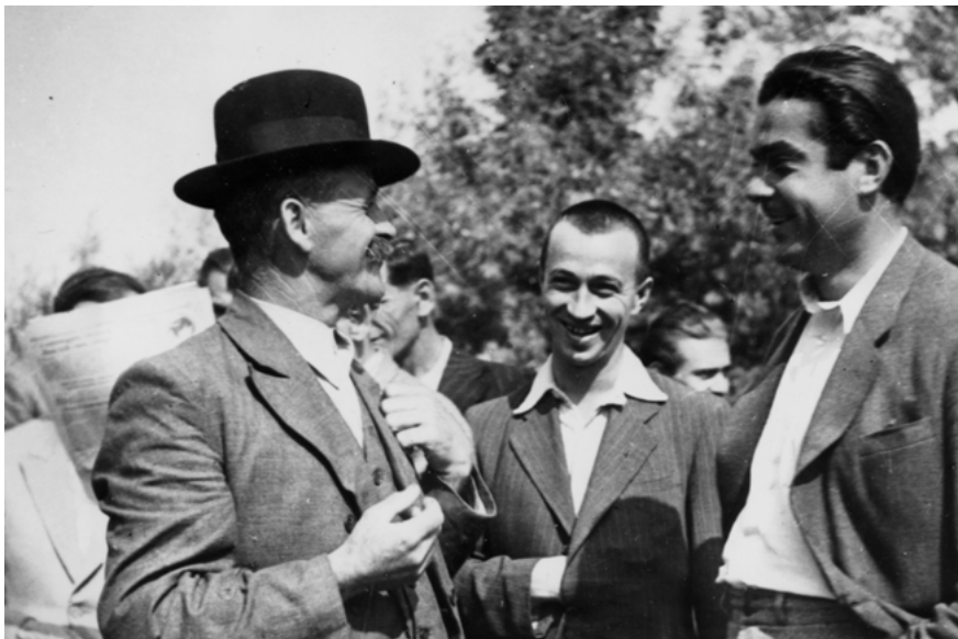
„Közép” és „jobb”. Veres Péter (balra), a Nemzeti Parasztpárt elnöke és Kovács Imre, a párt főtitkára 1946-ban.

az ország társadalmi és politikai berendezkedésének demokratikus átalakítása állt. 10 Pártszerű tevékenységet tulajdonképpen a világháború lezárásáig nem folytatott, ezt követően kerülhetett sor szervezeti kiépülésére.