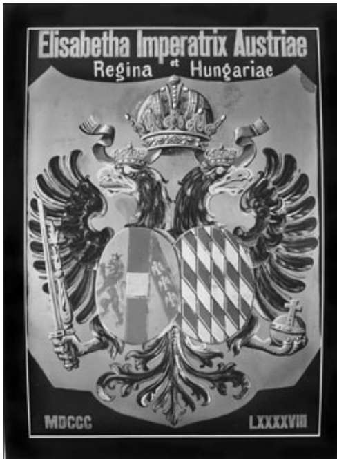
Erzsébet császárné és királyné Veszprémben fennmaradt halotti címere

eltekinve rendszerint a veszprémi püspökök voltak Magyarország királynéinak kancellárjai. Habsburg-házi királyaink korára ez a szokás már jó ideje végleg rögzült és állandósult. 8