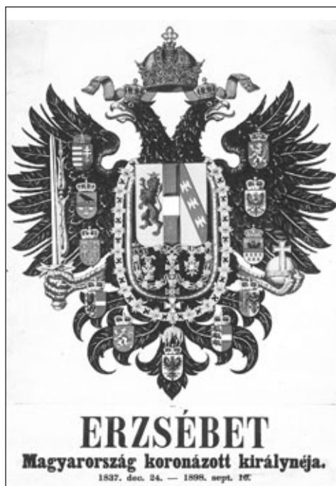
Erzsébet királyné Esztergomban fennmaradt állítólagos halotti címere (BEKE 1995. után)

kesegyházban a királyné lelki üdvéért mondott gyászmisén használhatták dekorációként.