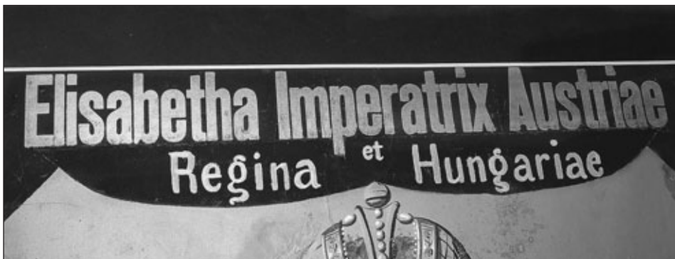
Az utólagosan kiegészített magyar királynéi cím Erzsébet halotti címérén (LDM, Sárközi Judit fényképe)

eltekinve rendszerint a veszprémi püspökök voltak Magyarország királynéinak kancellárjai. Habsburg-házi királyaink korára ez a szokás már jó ideje végleg rögzült és állandósult. 8