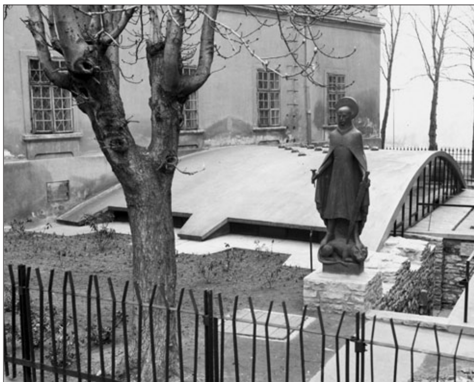
A Szent György-kápolna a védőtetővel, előtérben Szent Imre szobrával

ra van adatunk. Ezeket különbözőnek tekinthetjük az altemplombeli Szent Miklós-oltártól, mivel mindhárom (Szent András, Szent Péter, illetve Szent Miklós) titulus szerepel az 1556-os jegyzékben. Utóbbi esetében a biztosan altemplombeli Szent Imre-oltárral együtt nem jelölték annak kriptabeli elhelyezkedését.