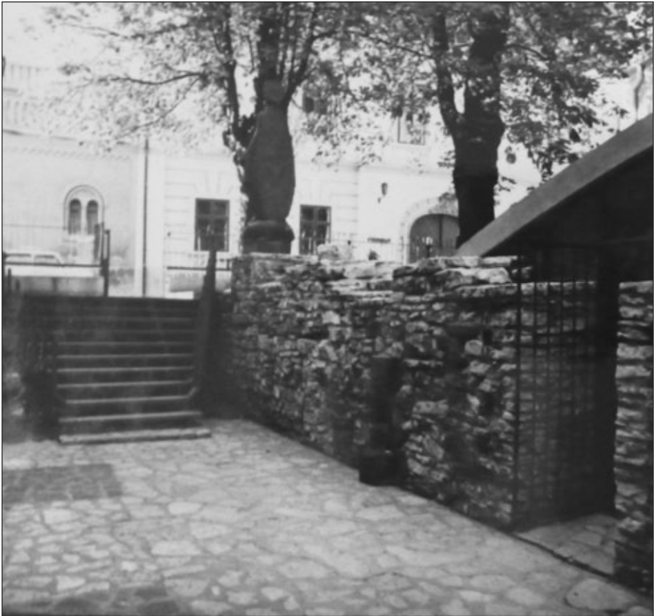
A Szent György-kápolna bejárata az egykori Szent Lélek-kápolna területére vezető modern lépcsővel (MÉM MDK 115.310.)

Említi: BÉKEFI 1907. 24., ÁDÁM 1912. 69., MEZŐ 2003. 89., BALASSA–BARANYA 2010. 138.