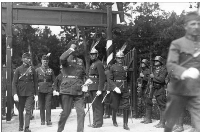
József kir. herceg, tábornagy szárnysegédeivel megérkezik az altisztképző intézetbe.

A zászlószentelés és a kapcsolódó ünnepek a sajtó és a fényképek alapján az alábbiak szerint rekonstruálhatóak.