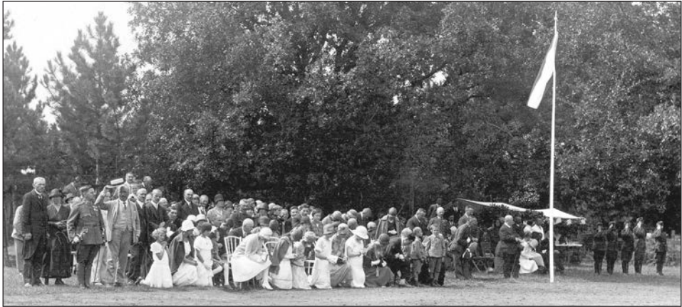
A zászlószentelési ünnep civil résztvevői a szentmise alatt.

Ezek után próbáljuk meg elhelyezni, beilleszteni a zászlót a korszak hazai katonai zászlói közé.