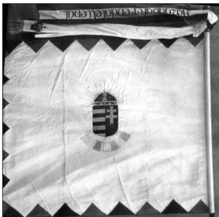
A m. kir. Veszprém–Jutasi honvéd Altisztképző és Nevelő Intézet zászlajának magyar címeres oldala. Jól látszanak a zászlószalagok is.