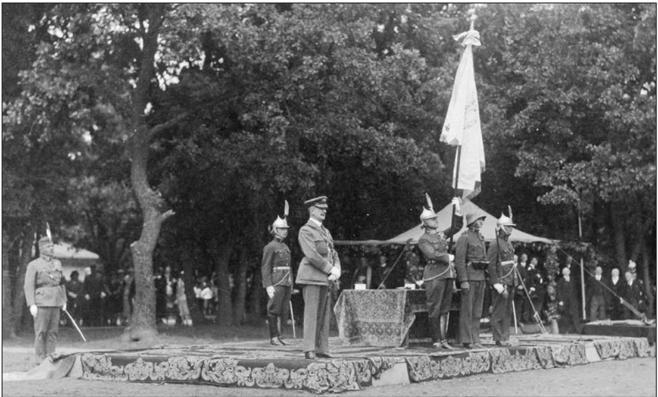
Horthy Miklós kormányzó méltatja a zászló jelentőségét.