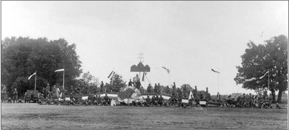
Az ünnepséget záró, Magyarország feltámadását jelképező irredenta élőkép.

haza feltámadását jelképező élőkép zárta. Az egy óraker kezdődő díszében elsőként vitéz bulcsi Janky Kocsárd lovassági tábornok, a m. kir. Honvédség főparancsnoka 38 köszöntötte fel a kormányzót.