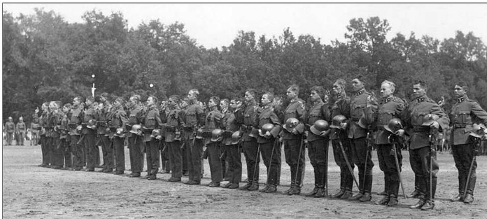
A végzett növendékek eskütetele. Jobbszárnyon pantallóban, karabéllyal a gyalogosok, balszárnyon csizmában, karddal a huszárok és tüzérek.