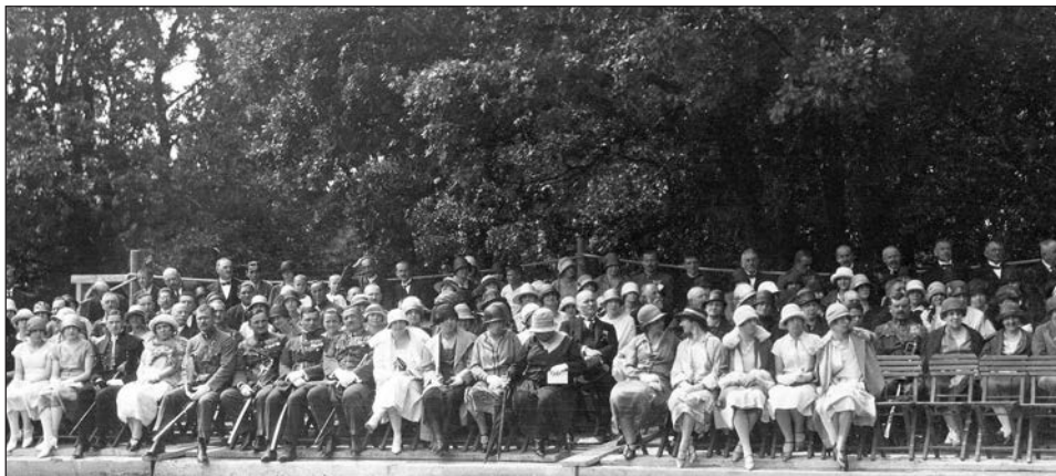
A zászlószentelési ünnep többségében civil résztvevői.

Az 1919-es tanácsköztársasági időszak lezárultával – amikor természetesen a zászlókon sem lehetett nemzeti jelképeket használni – a Nemzeti Hadsereg (1922 januárjától újra m. kir. Honvédség) zászlóhasználatát sajátos kettősség jellemezte. Az ország katasztrofális anyagi helyzete nem tette lehetővé, hogy a hadsereg alakulatait és intézeteit új zászlókkal lássák el. Ezért részben az 1918 előtti honvédség 1869 M csapatzászlóit 49 használták továbbra is. Jóllehet ezek a zászlók Magyarország középcímert (tehát a társországok címereit is, viszont még Fiume címere nélkül) és I. Ferenc József király névbetűjét hordozták, amely ábrázolások már nem feleltek meg az új hatalmi, politikai állapotoknak. Ráadásul a zászlók többsége a több évtizedes használatból már meglehetősen megviselt, elrongyolódott állapotban volt. Másrészt lehetővé tették azt is, hogy az egyes csapatok helyőrségéül szolgáló települések, illetve azoknak lakói zászlókat adományozhassanak az alakulatoknak. (Természetesen ilyenkor az adományozók viselték a zászlókészítés és adományozás összes költségeit). 50