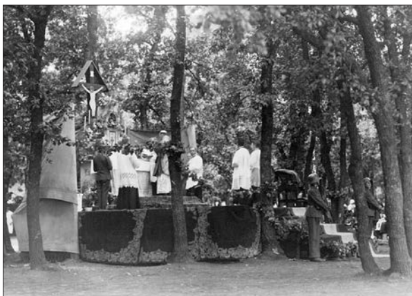
Rott Nándor püspök papi asszisztenciával a tábori oltárnál. A növendék díszőrök fegyverrel tisztelegnek.

A szentmisét Rott Nándor veszprémi püspök celebrálta. 34 A mise alatt a Veszprémi Dalegyesület és a kegyesrendi gimnázium énekkara templomi énekeket és a Himnuszot adták elő. A dísztüzet az intézet tűzér növendékei adták.