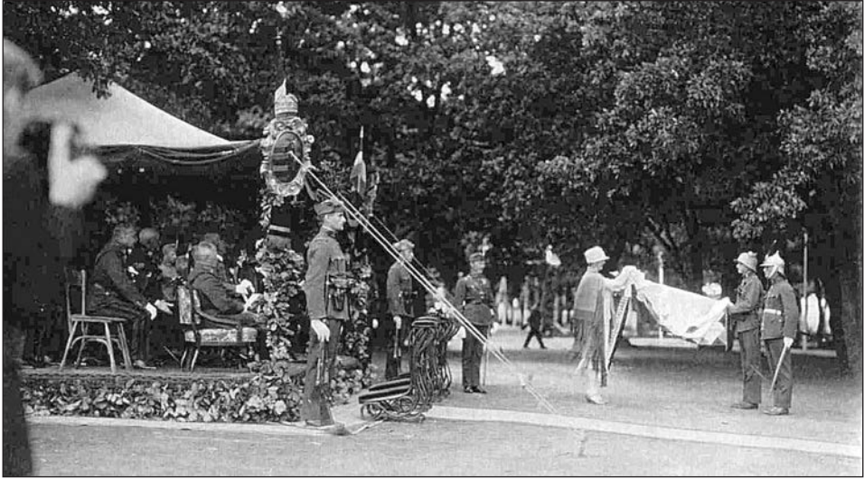
A kormányzóné felkötözi zászlószalagját a zászlóra. A dízsátor előtt testőrök állnak őrségben.