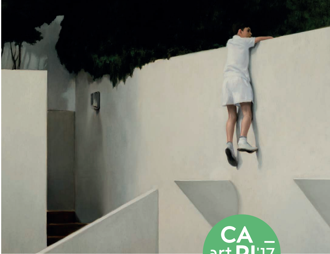
Jonathan Wateridge: Falon kapaszkodó fiú | Boy on Wall, 2012