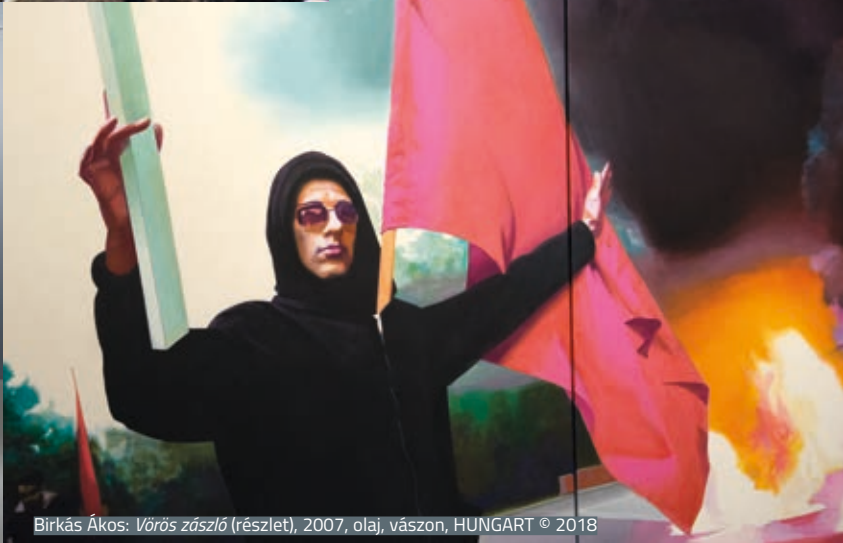
Birkás Ákos: Vörös zászló (részlet) , 2007, olaj, vászon, HUNGART © 2018