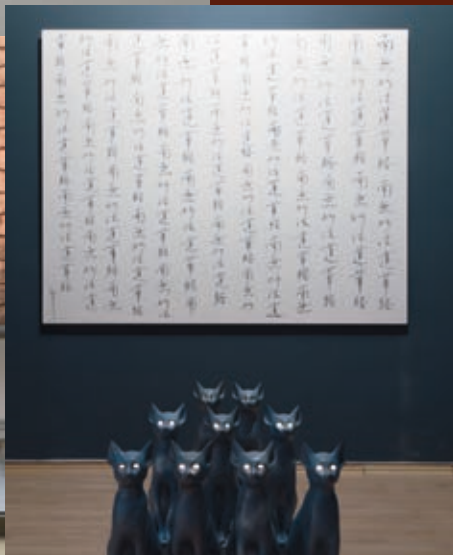
Yoko Ono: Bastet , HUNGART © 2018