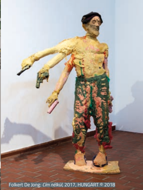
Folkert De Jong: Cím nélkül , 2017, HUNGART © 2018