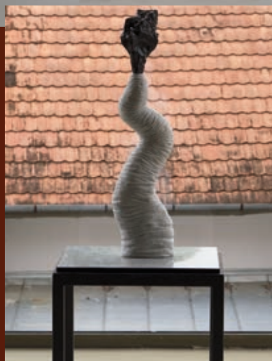
Martin Henrik: Exoplant , 2011, márvány, bazalt, gránit, vas, üveg