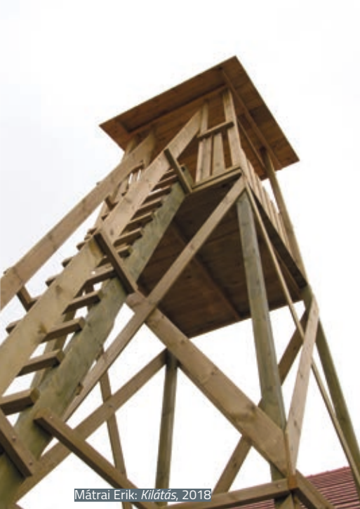
Mátrai Erik: Kilátás , 2018