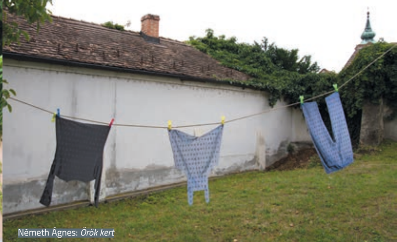
Németh Ágnes: Örök kert