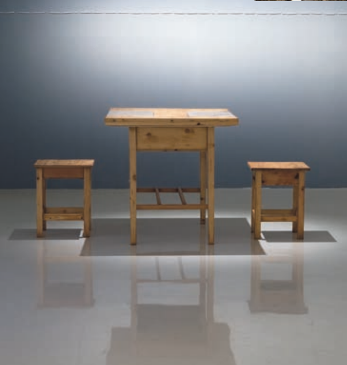
Imre Mariann: A mulandóság rögzítése