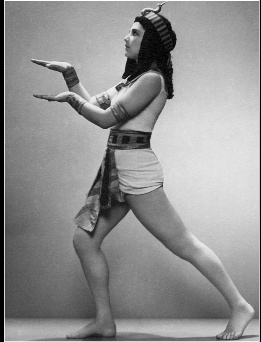
Verdi-Cieplinski: Aida balettbetét