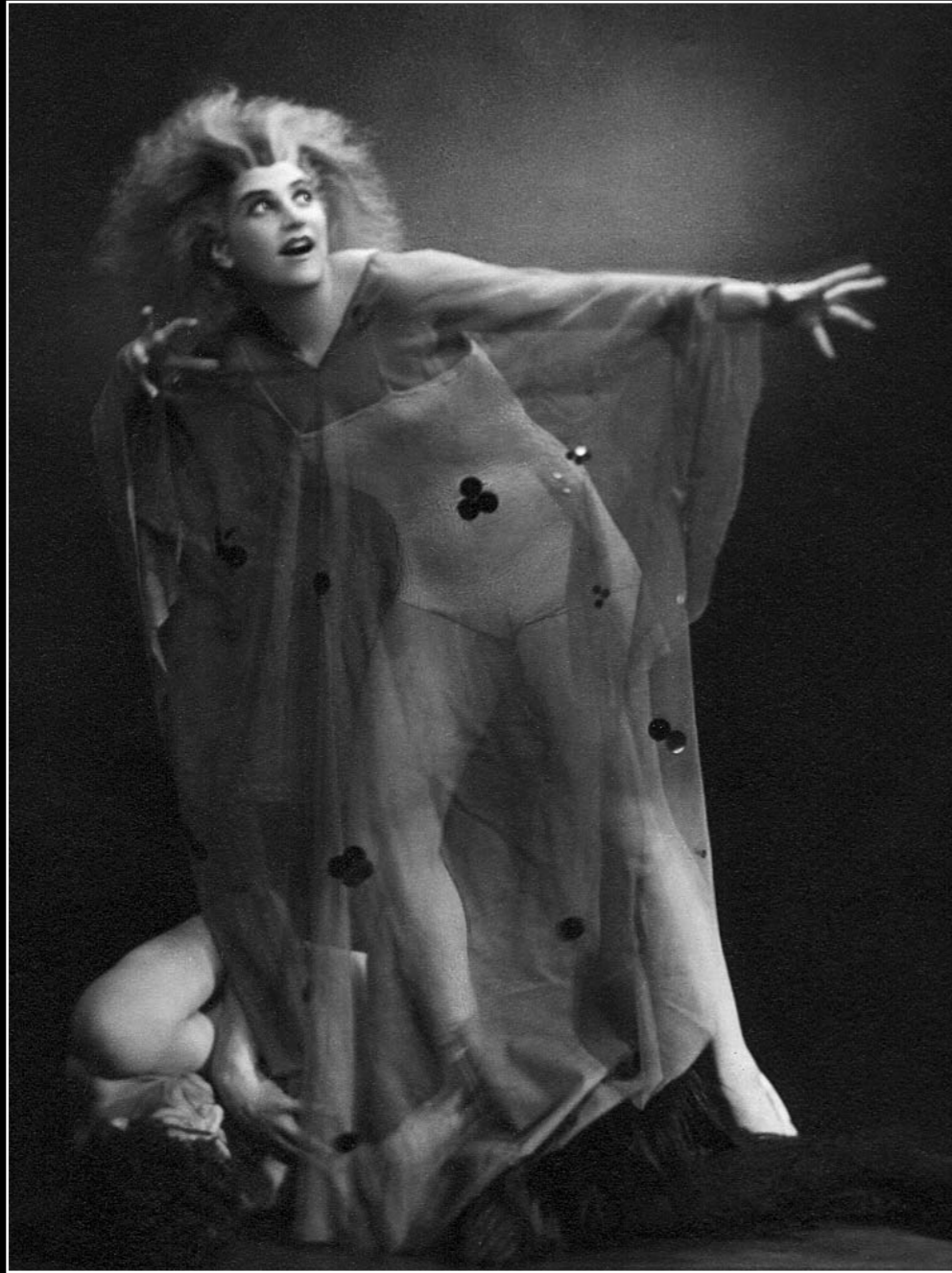
Gounod-Cieplinski: Faust balettbetét