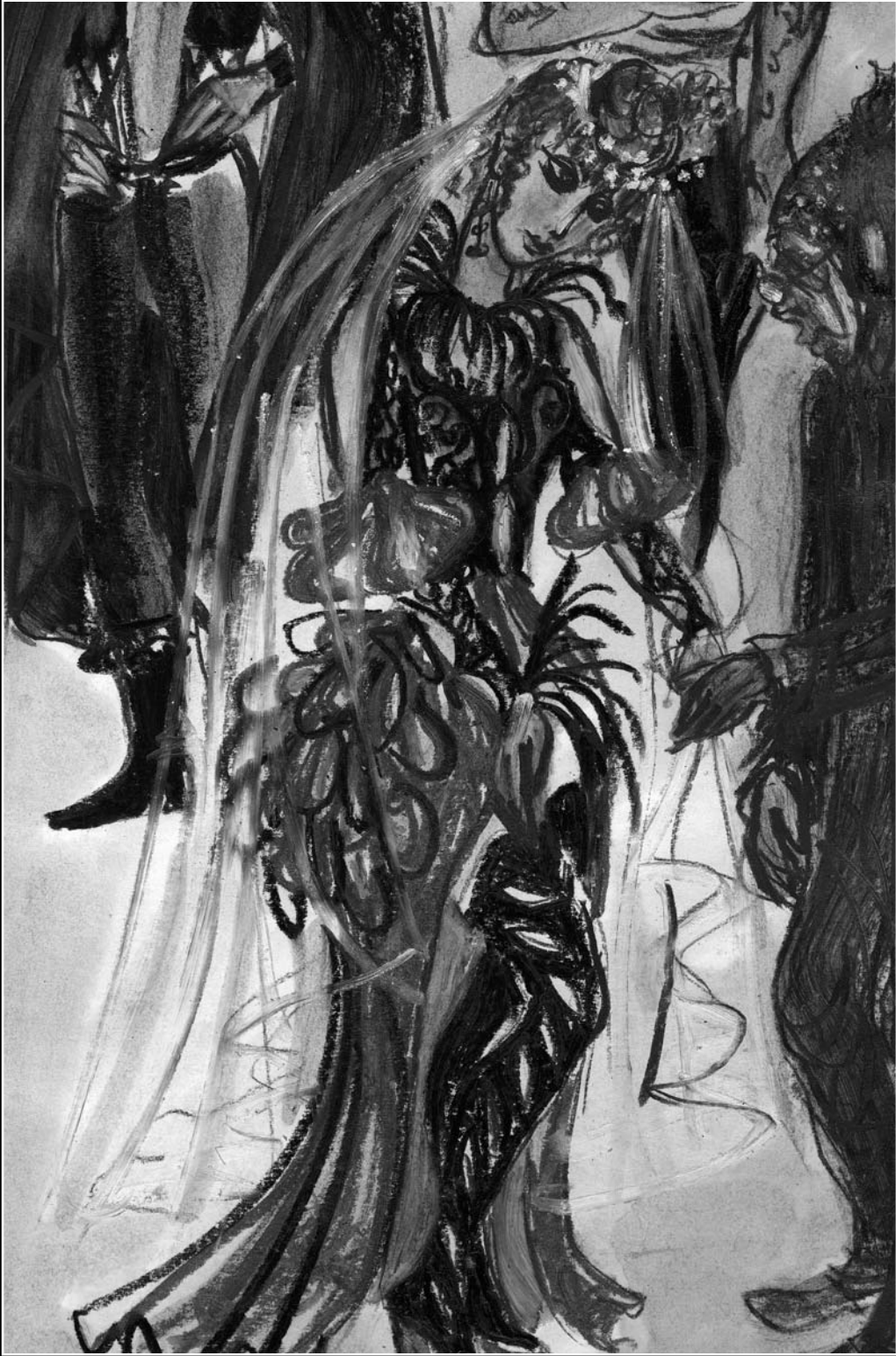
Shakespeare: Szentivánéji álom (vázlat, é.n.)