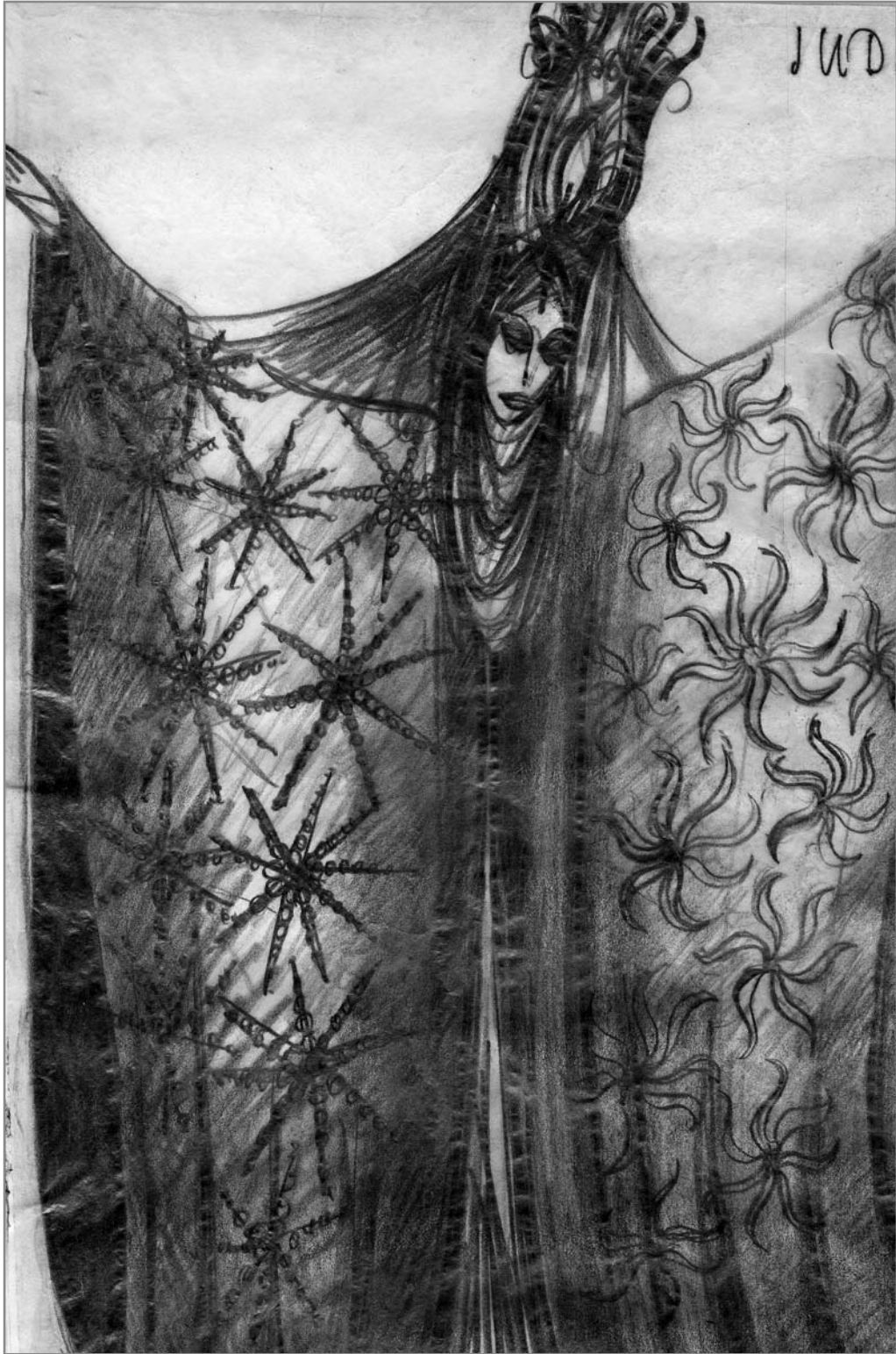
Bartók: A kékszakállú herceg vára ( Magyar Televízió, 1980)