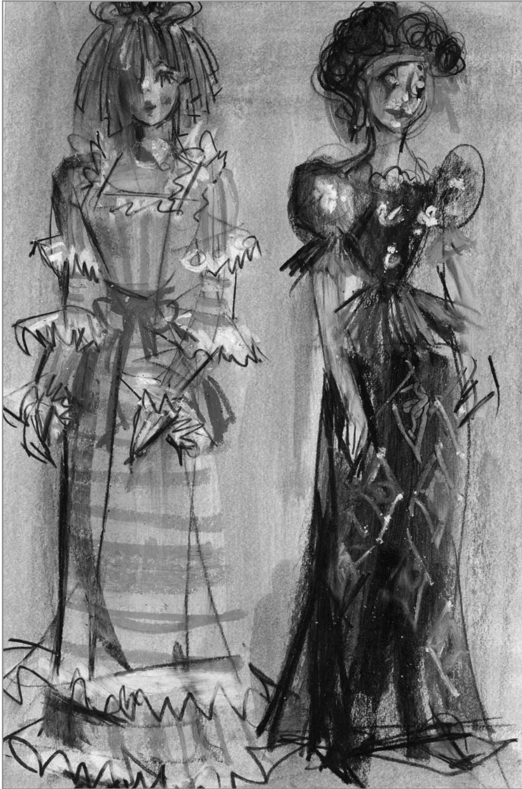
Molière: Kényeskedők (Nemzeti Színház, 1972)