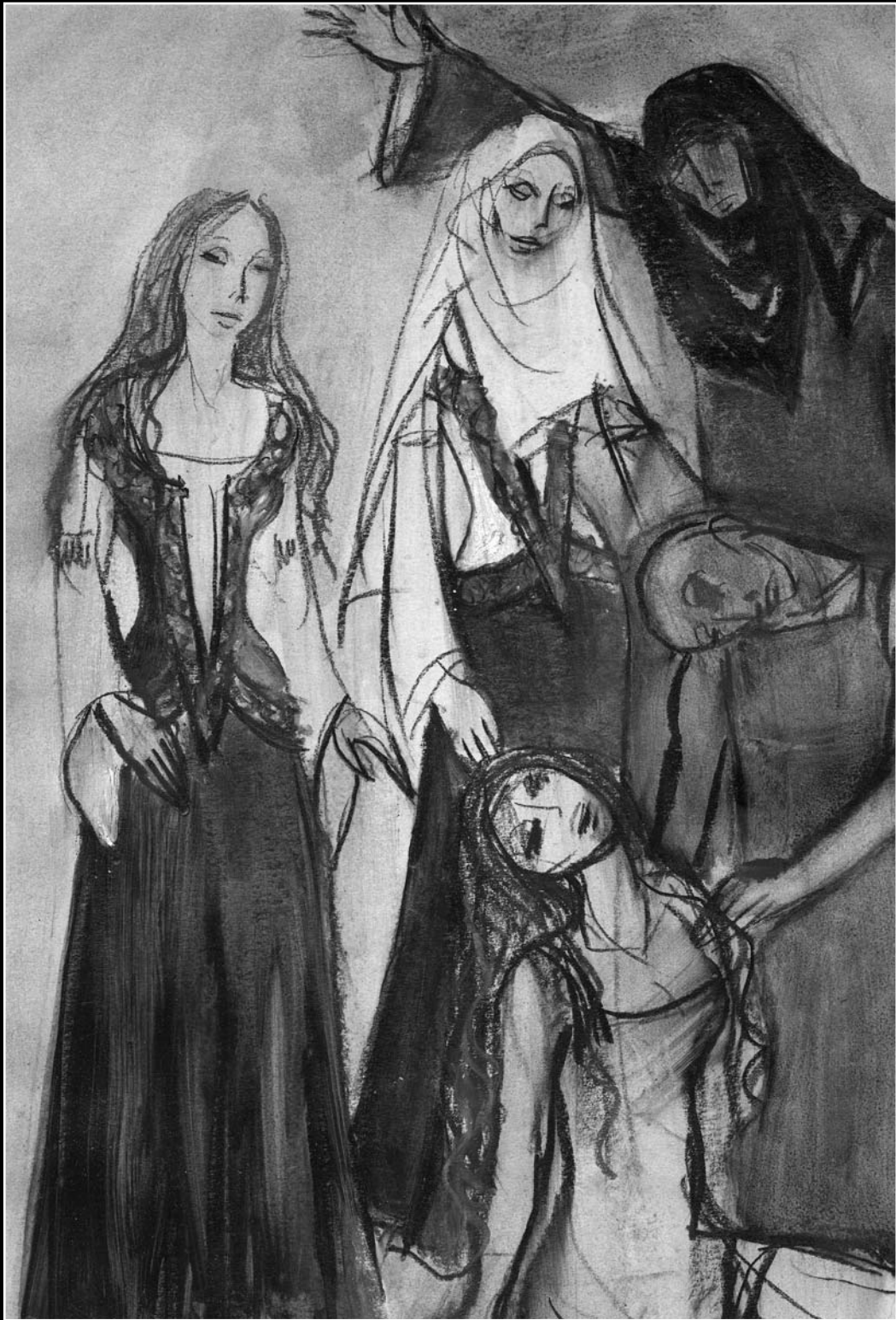
Sárospatak: Tánceztis (Pécsi Balett, 1976)