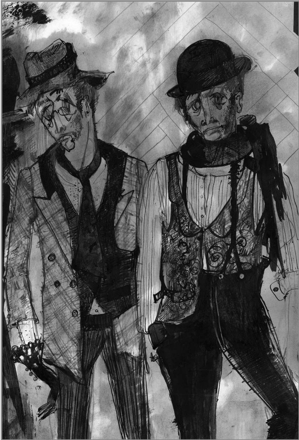
Brecht: Koldusopera (Békés Megyei Jókai Színház, 1960)