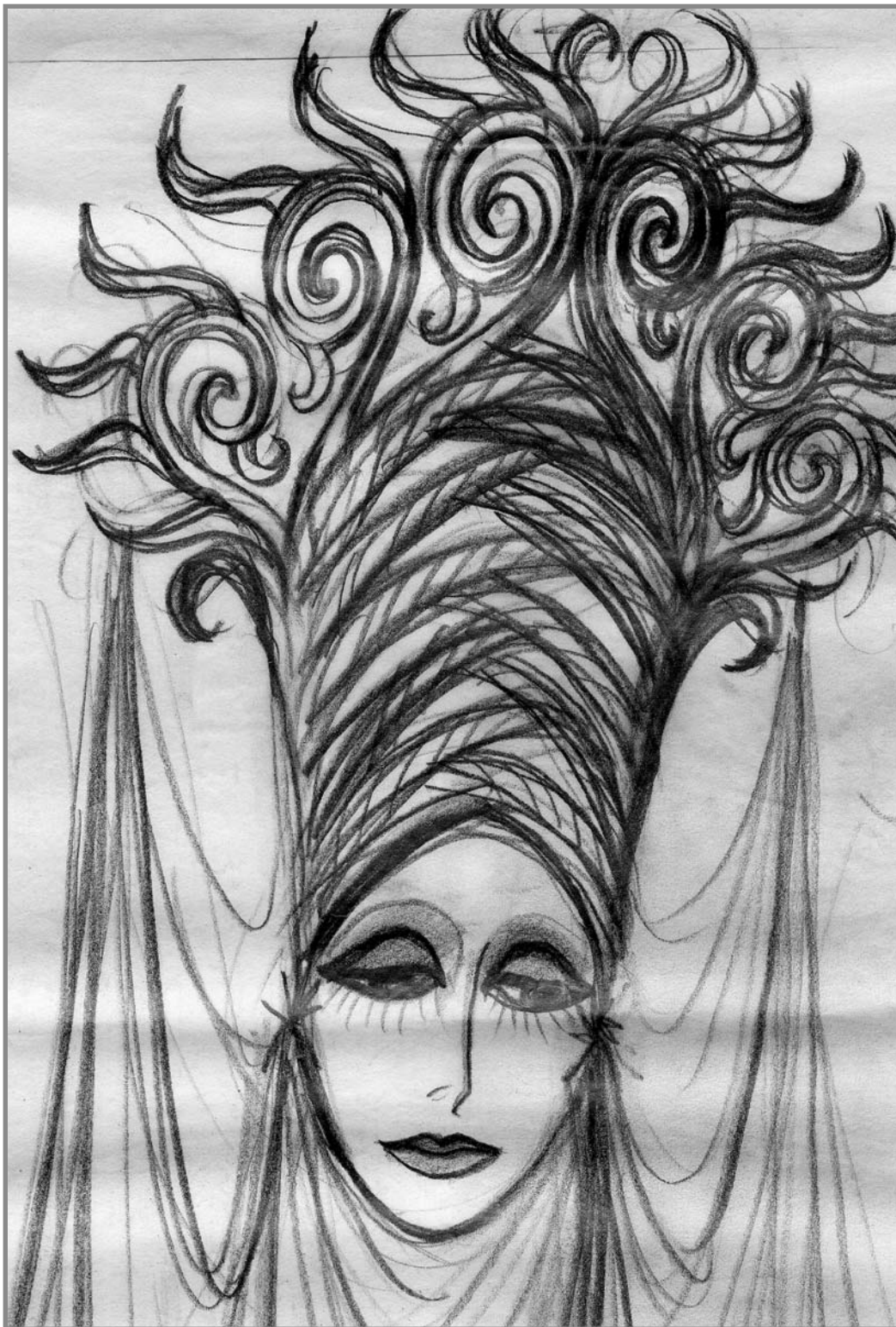
Bartók: A kékszakállú herceg vára ( Magyar Televízió, 1980)