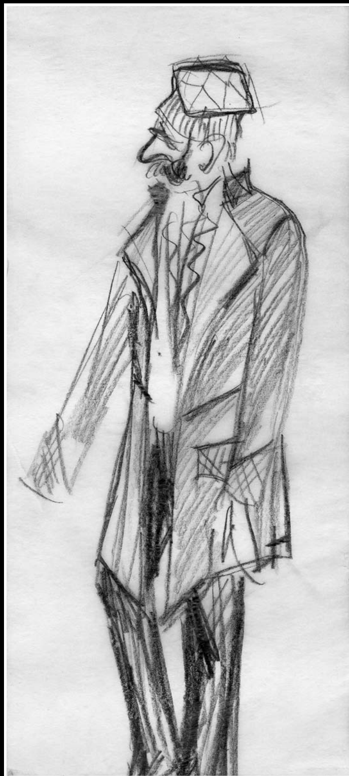
Dosztójevszkij: A félkegyemű (József Attila Színház, 1985)