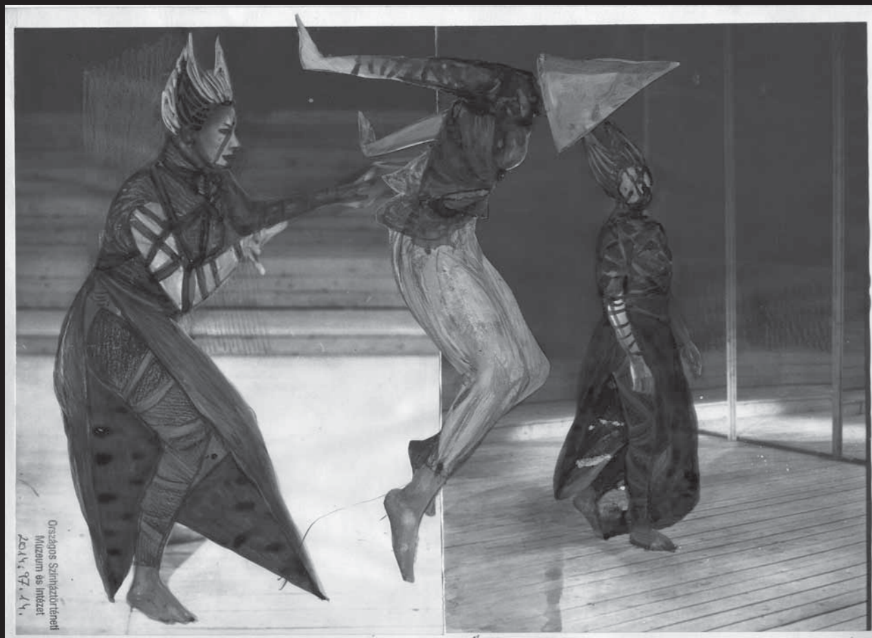
Jean Genet: Paravánok (rendező: Szikora János), Győri Kisfaludy Színház, 1981 31x21,5 cm, fotópapír, ceruza, kréta, filc El Kazovszkij jelmezterve, Országos Színháztörténeti Múzeum és Intézet

Tisztelt vendégek, barátok, hölgyeim és uraim,