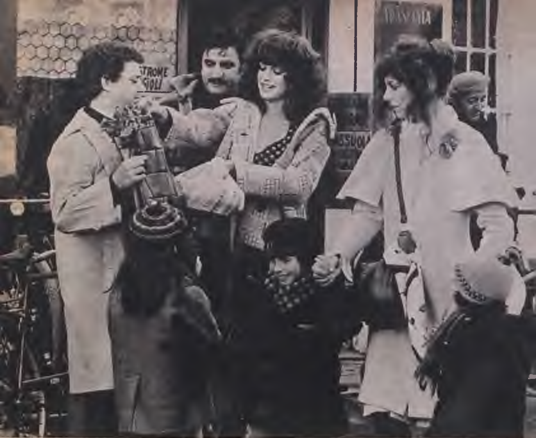
Jelenet Giorgio Capitani: Akiket forró szenvedély he- vít című filmjéből