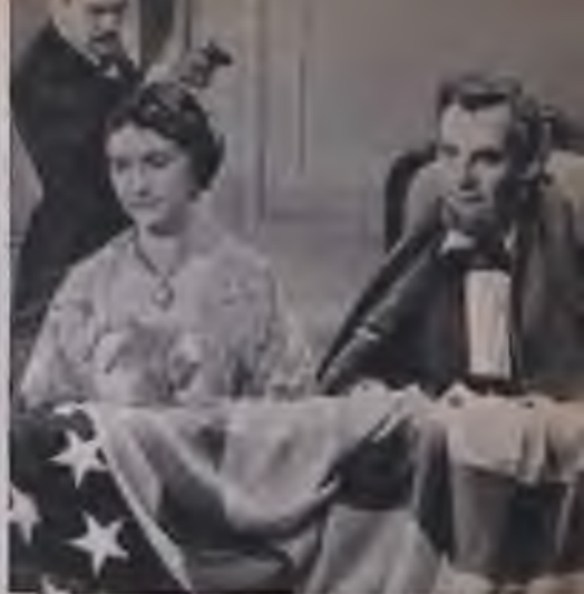
Walter Huston, Kay Hammond és Ian Keith a Lincoln Abraham című filmben

Amikor Griffith 1914-ben elkészítette Az anya és a törvény címmel a későbbi Türelmetlenség című alkotásának úgynevezett modern epizód-