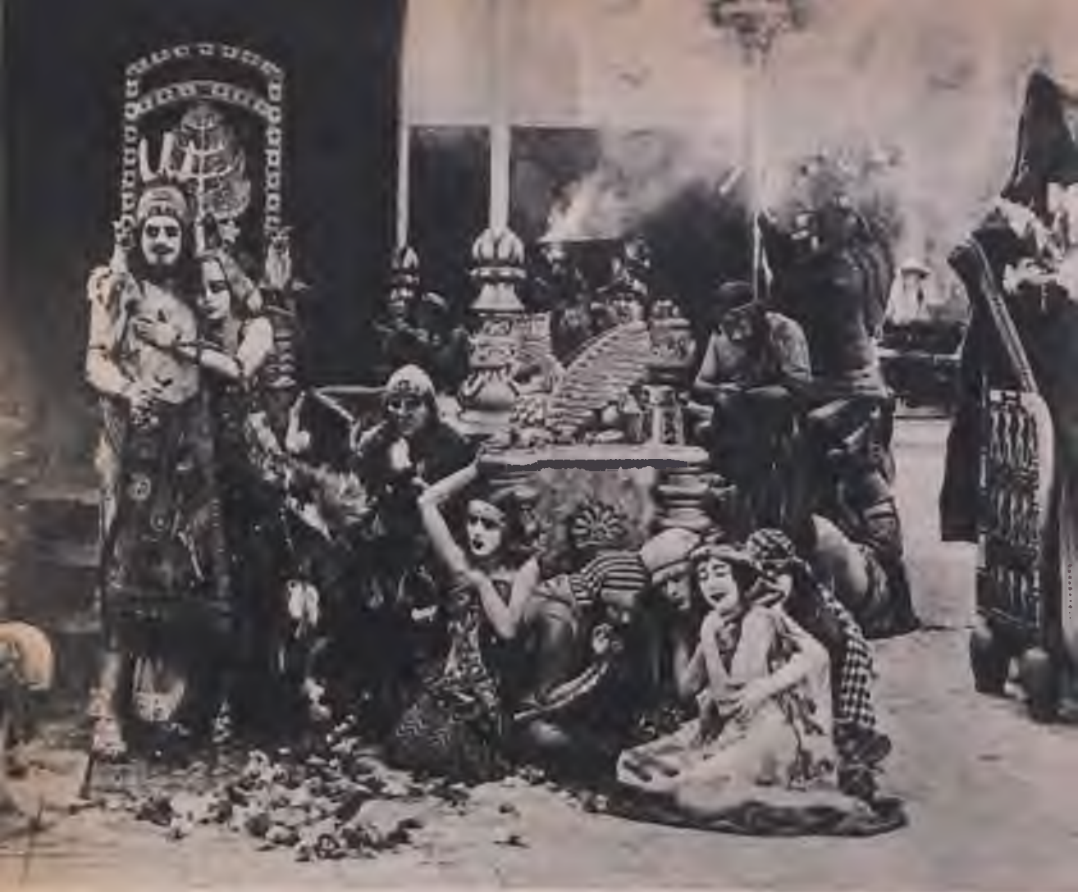
Jelenet a Türelmetlenség ből

tárja. Mégpedig a film legsajátabb eszközeivel, a kepek asszociációival.