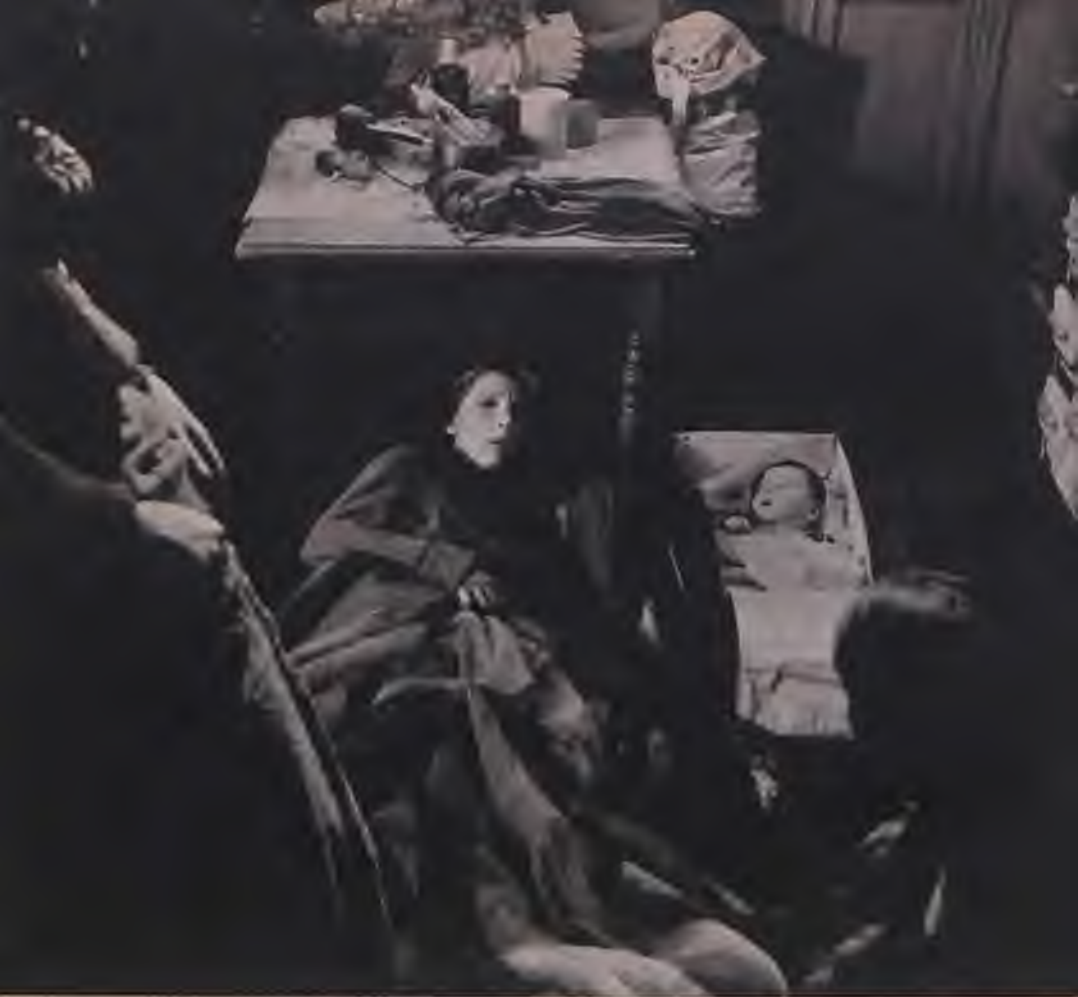
Jelenet a filmből

igazán jó olasz komédia a legmulatságosabb pillanataiban sem állította ezt soha. Ha egyáltalán pihenő volt Monicelli számára a Kedves Michele , inkább azért, mert benne a profi filmes kibújva a jó sztori vasfegyelme alól, hangulatoknak, milióknak, jellem- és helyzettanulmányoknak adhatta át magát; ismerős embereket, utcákat, lakásokat, meghittem privát bánatokat és csalódásokat szemügyre véve kicsit elmélázhatott. A Kedves Michelében egy profi filmrendező a profi-film teljes vértetében egy kitérő erejéig személyes hangon szólal meg, csaknem privátemberként. Nem önmagáról valló művészként, hanem hősei egyikeként, egyszerű ismerősükként.