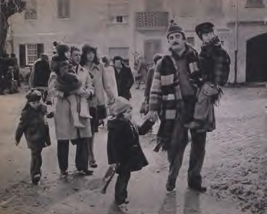
Giorgio Capitani: Akiket forró szenvedély hevít

a sok sikertelenségtől megcsömörlött rendőrt játszik. Egy ügyész mellé osztják be testőrnek. Az ügyész egy véletlen során rájön arra, hogy igen veszélyes fegyvercsempész banda nyomára bukkant. Hiába inti őt elővigyázatosságra testőre, az ügyész végül is az életével fizet alapos gyanújáért. Az ügyész utóda viszont a banda egyik tagja lesz, s ezzel elszánt párbaj kezdődik a sokat tudó rendőr és az új ügyész között, ami aztán mindkettőjük halálával ér véget.