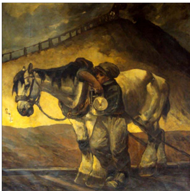
Haranghy Bányalovat vezető kisfiú című olajképe