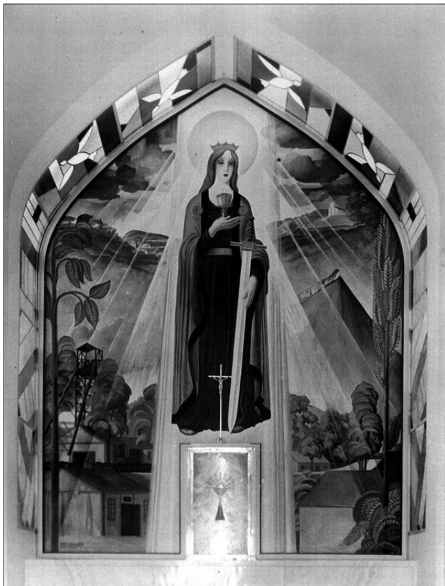
Jeges Ernő oltárképe az Augusztá-telepi templomban

Néhány héttel a dorogi bemutatót követően az esztergomi bazilikában is ez hangzott el a székesegyház avatásának évfordulóján – különös módon a Liszt-mise helyett.