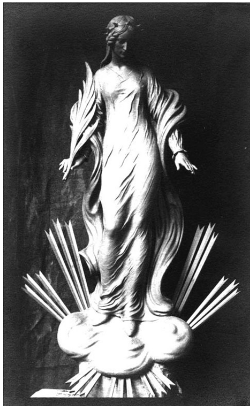
Mátray oltárképén Szent Borbála (a lenge)

Az egyik legszorosabb barátság az iparművészeti főiskola szobrásztanárához, Mátray Lajoshoz fűzte Gáthyt. „A szentély márvány főoltára és ízléses, aranyos szentségháza felett érdekes és teljesen újszerű az oltárkép, amely a templom védőszentjét, Szent Borbálát, a bányászok patrónusát ábrázolja, amint a bányában a hozzá folyamodó bányászoknak megjelenik. Az oltárkép Mátray Lajos (...) sikerült műve. A háttért fekete kőszénfal alkotja. Alul baloldalt csille mellett lámpáját a szent felé tartó bányász alakja áll, jobboldalt pedig térdre hulló, vagy bízón a szent felé néző meglepett bányászokat látunk.