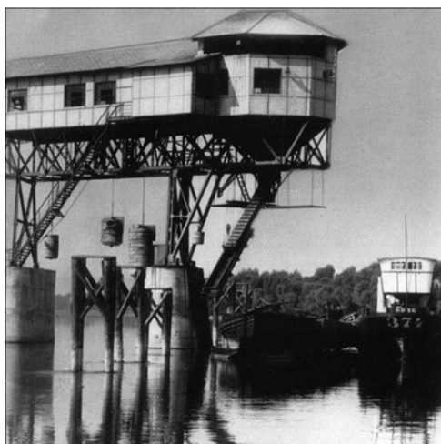
Gáthy dunai szénrakodója

Ezekre a kapcsolatokra utalhat a beszámoló az Esztergom hasábjain „ Herczeg Ferenc-művészt Dorogon . Előkelő és a művészetet értékelő társaság gyűlt össze február 24-én este a dorogi kaszinó díszes nagytermében, hogy egy minden tekintetben elsőrangú művészi előadásban és estélyen vegyen részt. A budapesti vendégek díszes sorában maga Herczeg Ferenc is megjelent, s az előadás folyamán számtalanszor részesült nagy ünneplésben. Az első darab: »A két ember« a bányász munkás és a főmérnök lelki-