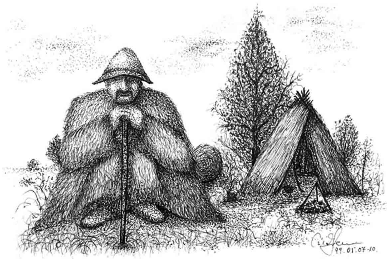
Czirok Ferenc: Kihunyó pásztortűz

1 Romsics Ignác (főszerk.): Magyarország története. Fodor István: 1. Östörténet és honfoglalás. Kossuth Kiadó, Budapest, 2009. 93. oldal