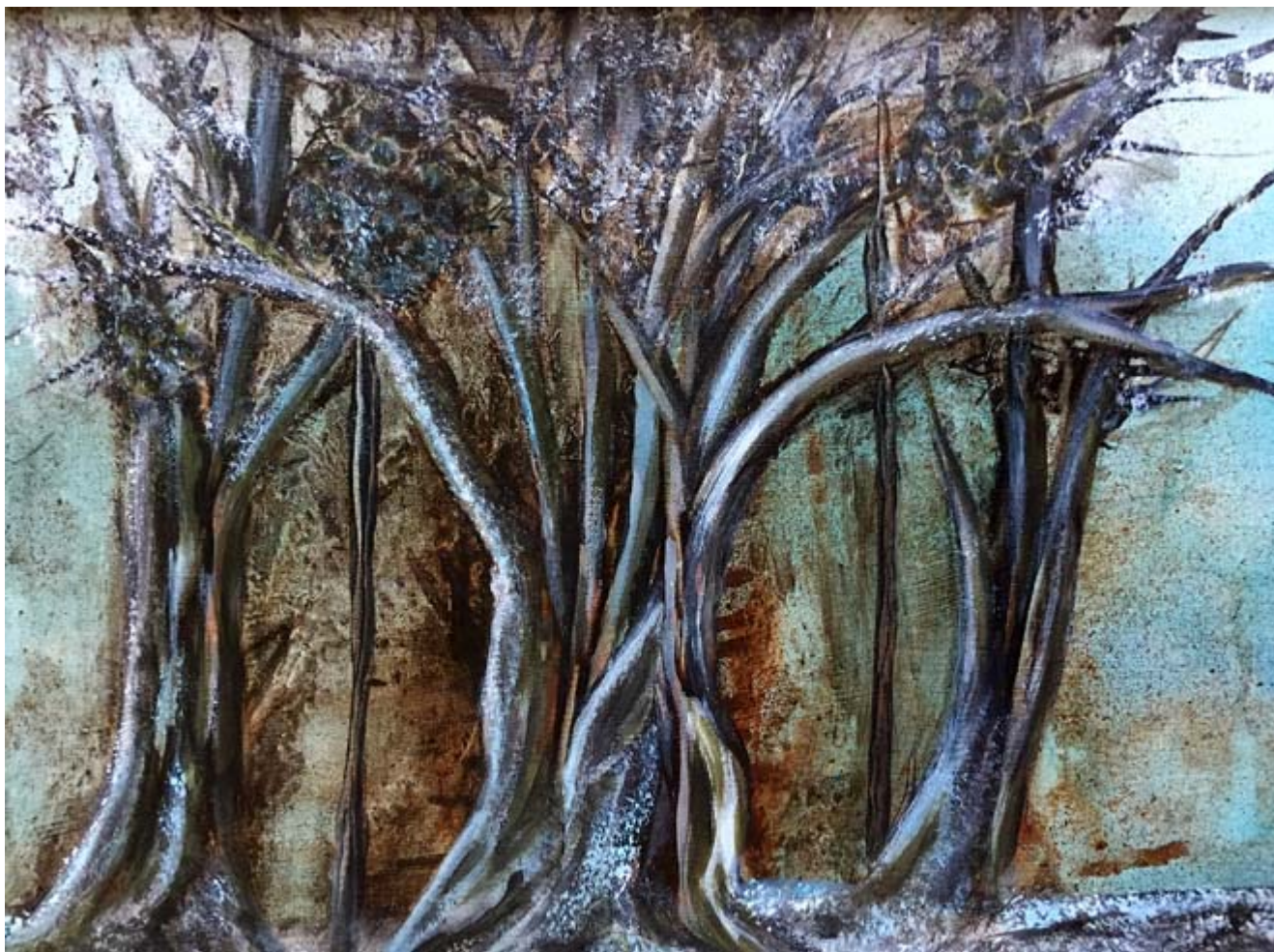
Czirok Ferenc: Deres már a határ