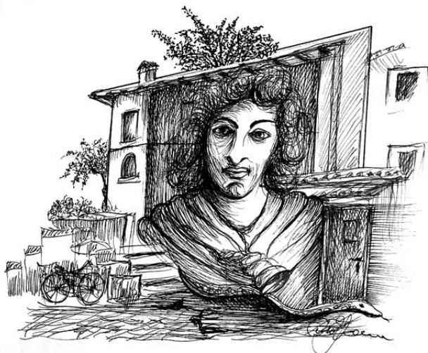
Czirok Ferenc: Lesbia

celánüzlet és a Vörös-féle, akkor már önkiszolgáló bolt előtt. A Rochlitz-féle gyógyszertárnál most továbbvitt az utam, nem kellett sem Erigon, sem Fagifor. [Hat-nyolc hónapos koromtól idült hörghurutom volt tizennégy éves koromig, akkor „hirtelen” kinőttem.] A sarkon túl, a Kossuth Lajos utcában már messziről illatozott a vetőmagbolt. Ott vettem meg Jókai Mór A három királyok csillaga című könyvét. (Akkoriban a szakkönyvek mellett szépirodalmat is árult ez az üzlet.)