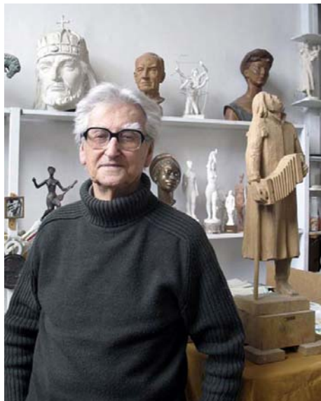
Búza Barna a műtermében

Részvétele csoportos kiállításokon (válogatás): 1934-től Nemzeti Képzőművészek Kiállítások, Múcsarnok (Budapest); 1937: Modern Monumentális Művészet, Nemzeti Szalon (Budapest); 1938: XXI. Velencei Biennále (Velence, Olaszország); 1939: Országos Magyar Képzőművészeti Társulat Őszi Tárlata, Múcsarnok; 1941: Magyar Egyházművészeti Kiállítás, Nemzeti Szalon; 1942: XXIII. Velencei Biennále; 1950-től Magyar Képzőművészeti Kiállítások, Múcsarnok; 1955: Képzőművészetünk Tíz Éve, Múcsarnok; 1957: Tavasz Tárlat, Múcsarnok; 1960: Képzőművészetünk a felszabadulás után, Magyar Nemzeti Galéria (Budapest); 1965: A Százados úti Művésztelép 50