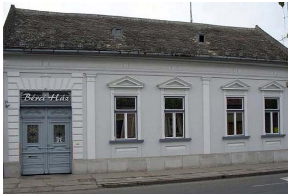
A műteremnek is szolgáló bajai ház