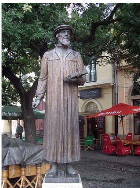
Búza Barna: Kálvin János

Búza Barna készített kisplasztikákat, portrékat, domborműveket, érmekeket, valamint köztéri szobrokat. Alkotásai fából, kőből, fémből, kerámiából, porcelánból (a Herendi Porcelángyár számára), terrakottából, magastűzőn égetett pirogránitból, valamint a saját találmányú pirobronzból készültek. Szobrászatát a klasszikus iskolázottság, a finom naturalizmus jellemzi. Művészi hitvallásában s műveiben az izmusok divatáramlatai ízlését, alkotói szándékait nem befolyásolták. Közérthető műveket alkotott, a felhasznált anyagok tulajdonságait tiszteletben tartotta. A korát jellemző politikai áramlatok nem téríthették el munkásságától. A nehéz időkben mindig sokat segítettek az egyházi megrendelések. Az egyházművészet tematikus művészet, amely tartalmával és szigorúan meghatározott alkatelemekkel (ikonográfia), de meglehetősen szabadjára hagyott formavilággal (természetes vagy stilizált) valamely, az alakos ábrázolást megtűró vallásnak vagy felekezetnek céljait szolgálja. Hosszú ideig az egyházművészet volt az európai művészettörténet legfontosabb területe. Búza Barna Herenden készítette azt