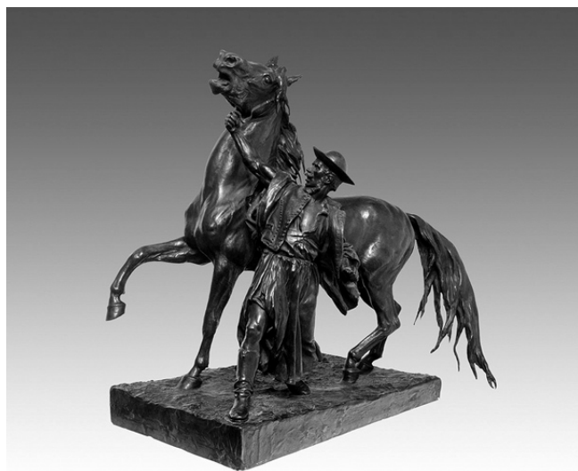
Ifj. Vastagh György: Lovát megfékező csikós

Alsó-torjai lófő ifj. Vastagh György (Kolozsvár, 1868. szeptember 18. – Budapest, 1946. június 3.) szobrászművész, állat-és emlékszobrok híres mestere. Az erdélyi Háromszékről származó Vastagh művészcsalád különböző műfajokban maradandót alkotó tagjai három generáción keresztül, százhusz éven át voltak jelen a 19-20. század magyar képzőművészetében.