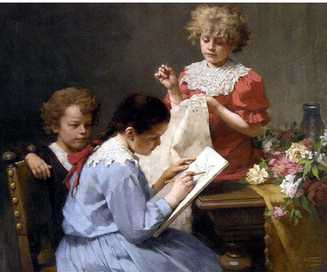
Id. Vastagh György: Rajzoló kislány (1876)

1858-ban Kolozsvárra települt, és Veress Ferenc (1832–1916) fényképésszel közös műtermet nyitott. Stein János (1814–1886) könyvkereske-