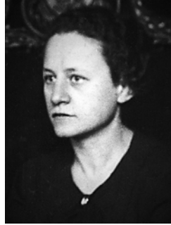
Vastagh Éva arcképe

Síremlékei: Csiky József (1881–1929) síremléke (1932), Budapest, Kerepesi temető. Haltenberger család (1875–1956) síremléke (1936), Budapest, Kerepesi temető. Gyárfás Gyula síremléke (1945-ben megsemmisült), Budapest, Farkasréti temető.