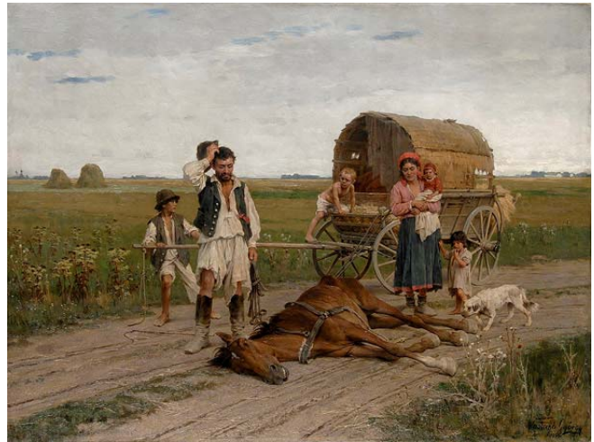
Id. Vastagh György: Kárvallott cigány (1886)

Vastagh György festői kvalitásaira gróf Mikó Imre (1805–1876) hívta fel a figyelmet az 1850-es évek végén, ezt követően a kolozsvári arisztokrácia megrendelésekkel halmozta el. 1859-ben kapta az első nagy megbízását báró Kemény Istvántól (1811–1881), Kemény Simon halálát a szebeni csatában (1442. március 25.) ábrázoló öt részes képciklus megfestésére az Erdélyi Múzeum-Egylet (1859–1949, 1990–) számára. Ugyanez évben készült az Egylet részére Kazinczy Ferenc (1759–1831) arcképe is, valamint gróf Bethlen Károly (1826–1886) megrendelésére a Vitam et sanguinem jelenet (a magyar nemesség Mária Terézia trónjának védelmében életét és vérért ajánlja fel). 1860-ban gróf Kendeffy Ádám (1795–1834) és Brandenburgi Katalin (1604–1649)