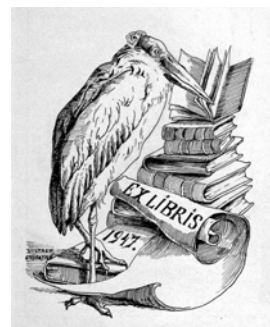
Ifj. Vastagh Györgyné Benczúr Olga: Ex libris ter

Művei szerepeltek a Vastagh művészcsalád emlékiállításán 2004-ben az Ernst Múzeumban.