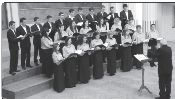
Marosvásárhelyi Nagy István Ifjúsági Énekkar