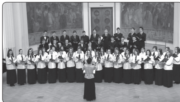
Kolozsvári Református Kollégium Vegyeskara