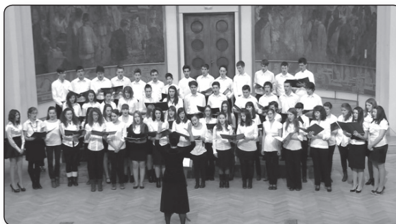
Kolozsvár Sigismund Toduta Zenelíceum Vegyeskara