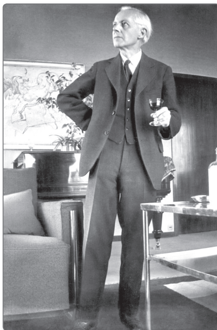
Bartók Béla A Zene húros hangszerekre bemutatója után, Sacher otthonában a Schönenbergen

„Milyen volt Bartók Béla, az ember? – Keskeny alakja törekenynek hatott.