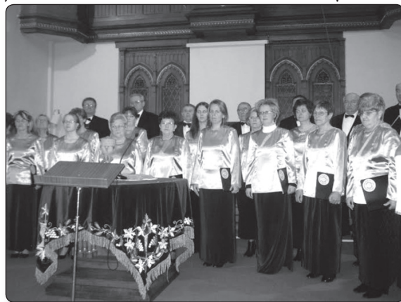
Kaposvári Zenekedvelők Kórusa

Másnap, vasárnap reggel az Együd Árpád Művelődési Központban Mindszenty Zsuzsánna a jelenlévő énekeseknek bemutatott néhány kórus-