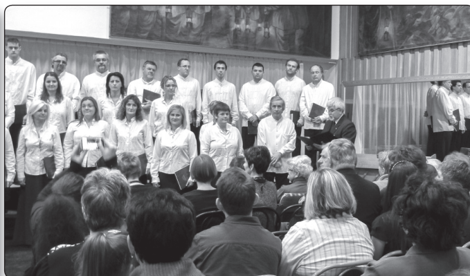
A 35 éves a Komlói Pedagógus Kamarakórus