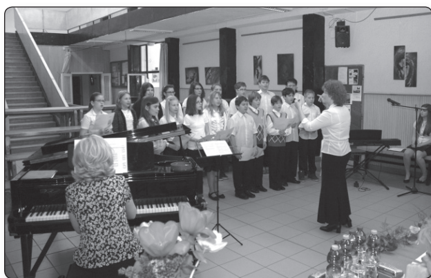
Tiszaparti Római Katolikus Általános Iskola és Gimn. Gyermekkórusa

napköszöntője kisdob kísérettel, jó tempóban szólalt meg, két lány és három fiú szólócsoporttal variált formálásban. Vavrinecz: Marosszéki dalok népdalfeldolgozása tisztán csendült fel, ez a hosszabb lélegzetvételű darab is elbírt volna, ha nagyobb „tűzzel” éneklük. A zsűritől Arany diplomával minősítést kapott a frissen alakult, szépen teljesítő kis kórus.