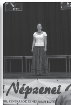
Népzenei KÖZÖSSÉGI HÁZ ÉS NÉPZENEI EGYESÜLET