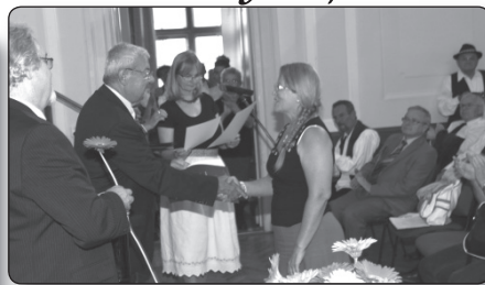
A zsűri értékel