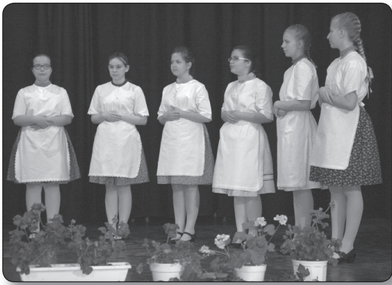
Kalácska - Kazincbarcika