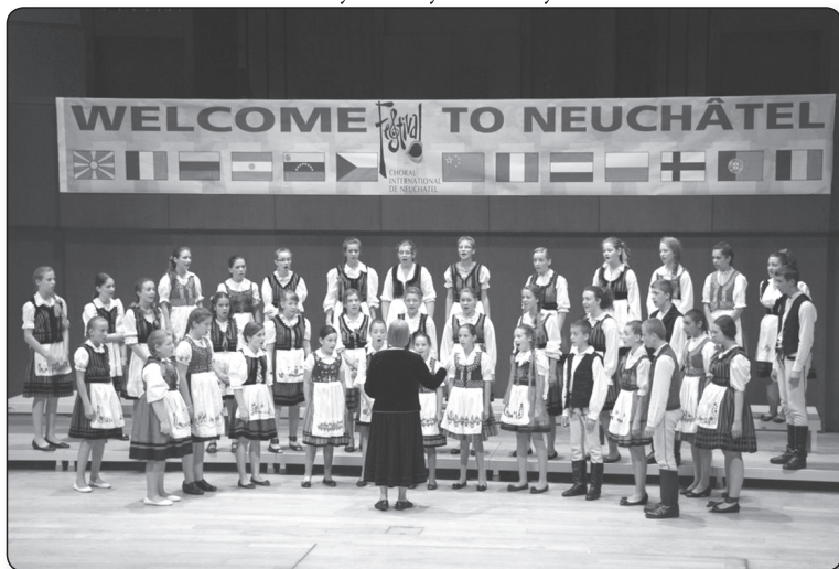
Marosszéki Kodály Zoltán Gyermekkar Szovátáról