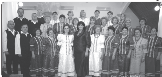
Deszki Népdalkör

ének-zene tanár, népzeneész, 35 éve dalvivő ember. Népdalénekesként, a szegedi női tánc házi zenekar, a Bodza Banda brácsásaként, a Deszki Népdalkör vezetőjeként egyaránt kiemelkedőt alkotott. Nagyszerű, hogy saját gyermekeivel is megszerette a népzeneét. Mindkét fia Aranypáva díjas, kiváló hangszeres szólista, akik szintén erősítik a deszki együttest.