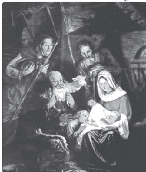
a ZeneSzó szerkesztője és a KÓTA vezetősége

Minden Kedves Olvasónknak Áldott Karácsonyt és Eredményes, Békés Új Esztendőt kívánunk szeretettel 2014 Karácsonyán!