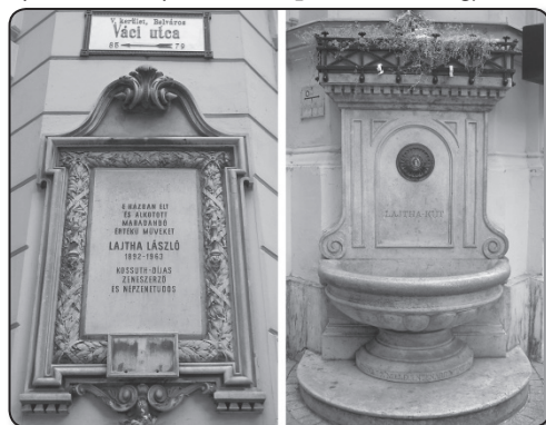
A díszkút, rajta a felirat: Lajtha Kút