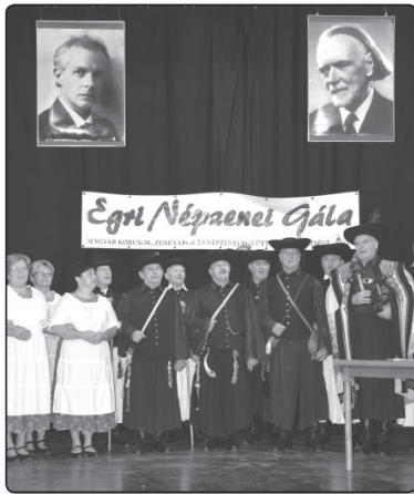
Törő Gábor Népdalkör, Püspökladány