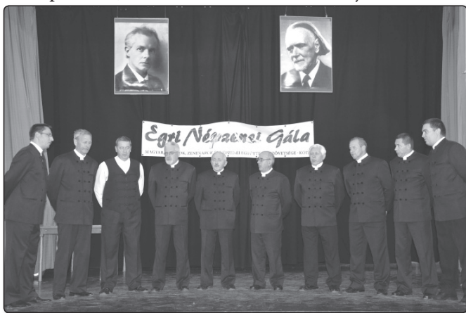
II. Rákóczi Ferenc Férfikar, Csóka