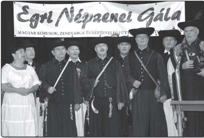
Törő Gábor Népdalkör, Püspökladány