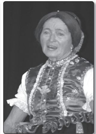
Gyöngyöstarjáni asszony énekel