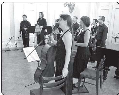
A Weiner-Szász Kamaraszimfonikusok