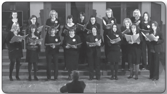
Stellaria Media Nőikar