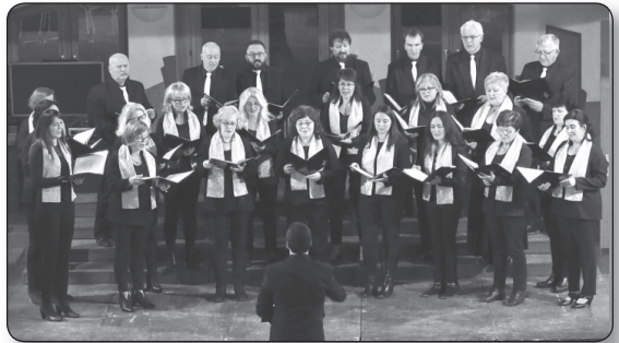
Musica Aurea Vegyeskar