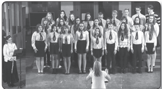
Fülemlé Gyermekkár - Veresegyház