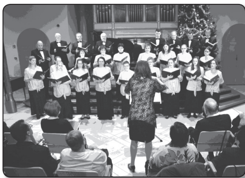
Szekszárdi Gárdonyi Zoltán Református Együttes