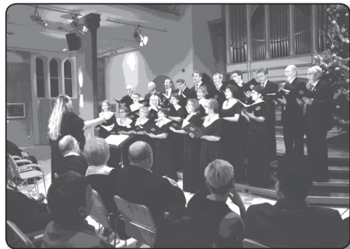
Tinódi Vegyeskar (Szigetvár)

kitáruul, szárnyal énekelve, s mint forró könny zubog reánk az emberség igaz szerelme, Hát áradj ránk, forró zene, taníts az emberség dalára! Őrködj szikáran ősz zenész, barátodért is pártot állva. S maradj velünk, hogy általad szeresse még e nép a sorsát; hogy nem veszett el, megmaradt a dalban-élő Magyarország!