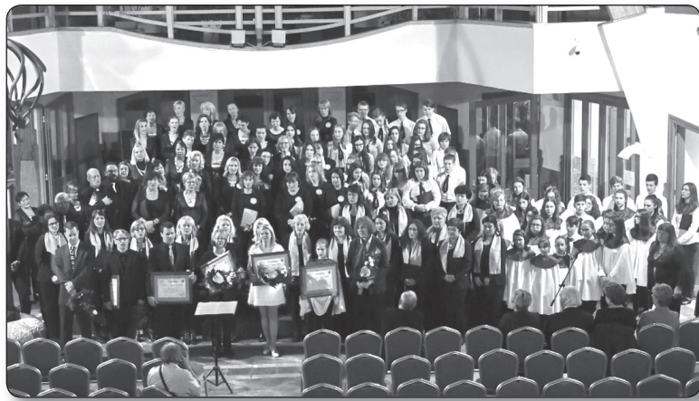
A kórustalálkozó résztvevői - Veresegyház