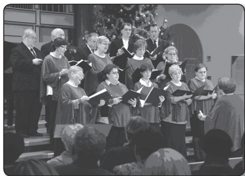
Kaposvári Református Kórus