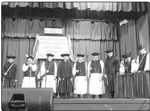
A rendezvényt az NKA támogatta.