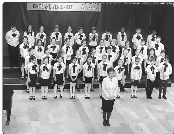
Kicsinyek Kórusa Kodály Z Ált Isk. és AMI Tatabánya