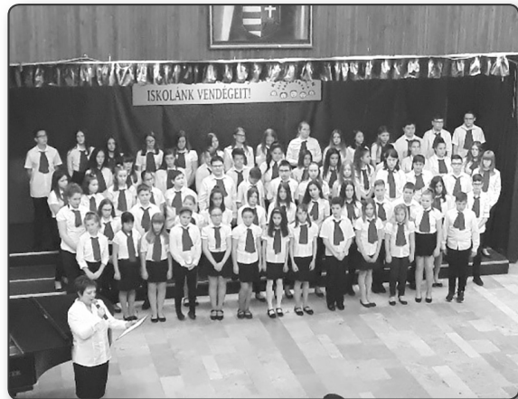
Kodály Kórus Kodály Z Ált Isk. és AMI Tatabánya

karvezető, mesterpedagógus, szervező a KÓTA Ifjúsági- és Zenepedagógiai Szakbizottságának tagja