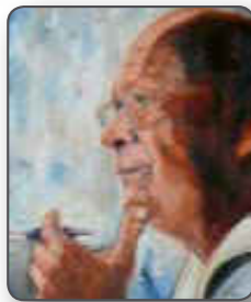
Géczy Olga festménye

Mindenki így hívta, mint a címben szerepel, de azt nem tudom, hogy ő erről tudott-e. A mi évfolyamunk volt az utolsó, akiket diplomáztattott. Három pillanatot idézek föl emlékeimből, mely ezt a korszakot jellemezte.