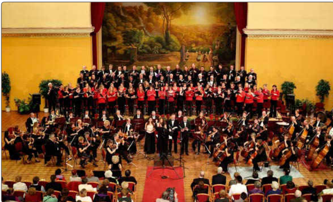
Kodály Zoltán VII. Magyar Kórusverseny nyitóhangversenye, 2015. november 19. Budapesti Olasz Intézet – Fotó: Birinyi József

A KÓTA szakbizottságai közül az 1990-es átalakulás óta az Ifjúsági és Zenepedagógiai Bizottságnak különlegesen fontos szerepe volt. A jövő kulturált társadalmának felnevelése, ízlésének, igényeinek kialakítása, kreativitásának fejlesztése az iskolában történik. Éppen ezért a KÓTA 14 tagú, különféle iskolatípusokat képviselő Ifjúsági Szakbizottsága naprakész információkkal, az illetékesekkel való kapcsolatok kiépítésével, és folyamatos munkával igyekszik az iskolai tanítás,