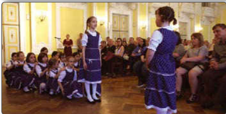
„Angyalkert” hangverseny Kodály Zoltán tiszteletére, népszokásokat megidézõ kórusműveiből

illetve az ifjúsági kórusok ügyeit jó irányba befolyásolni.