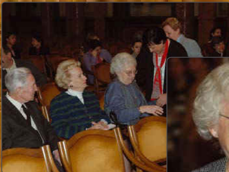
Gyülekezik a közönség