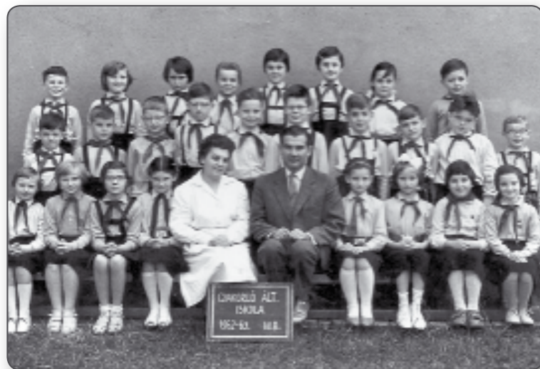
„1962-től a Budapesti Tanítóképző Intézet Gyakorló Iskolájának ének-zenetanára lett...”

majd tanárként működött. 1988-ban vonult nyugalmába, de az esti tagozaton még tovább tanított 1995-ig. 2004 év végéig tanított a Nemzetközi Pető Intézetben, ahol a leendő konduktorokat oktatta ének-zenére.