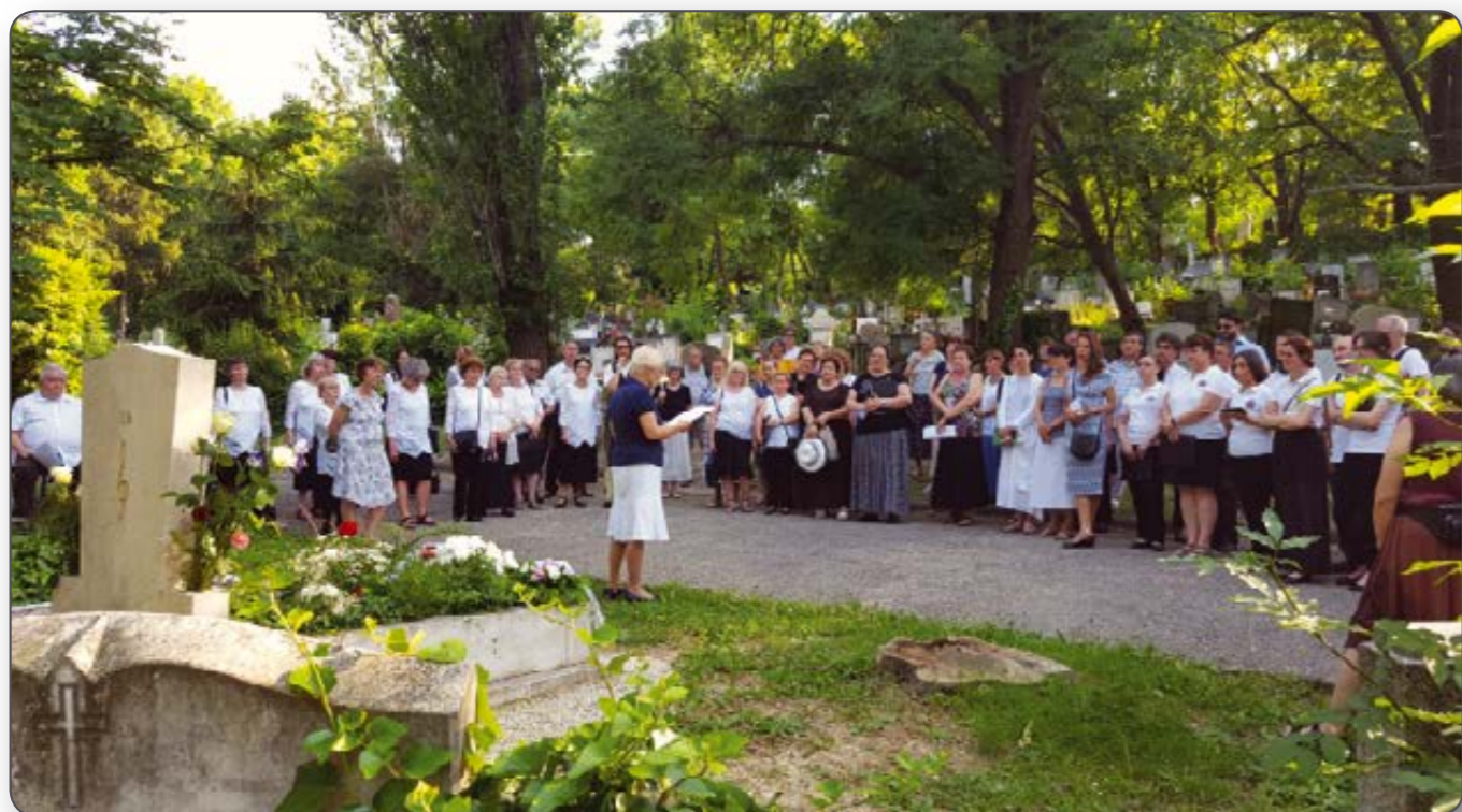
A kórusok: Fővárosi Énekkar, Tatabányai Bányász Vegyeskar, Ifjú Zenebarátok – most – Örökifjú Zenebarátok, és akik eljöttek tanítványok a Veres Pálné Gimnáziumból és a Bartók Konzervatóriumból.

a társaság, mindig maradt egy kör, akinek nem akaródzott még elsietni. Ilyenkor lett barát, vidám, igazi társ a harmincas évei elején járó fiatal tanár. Napközben, ha végigviharzott a folyosón, mert éppen szünet volt, megváltozott a légkör, az iskola különös varázslattal telt meg. Nem csak a kórusban éneklőkre volt elementáris hatással, hanem mindenkire!