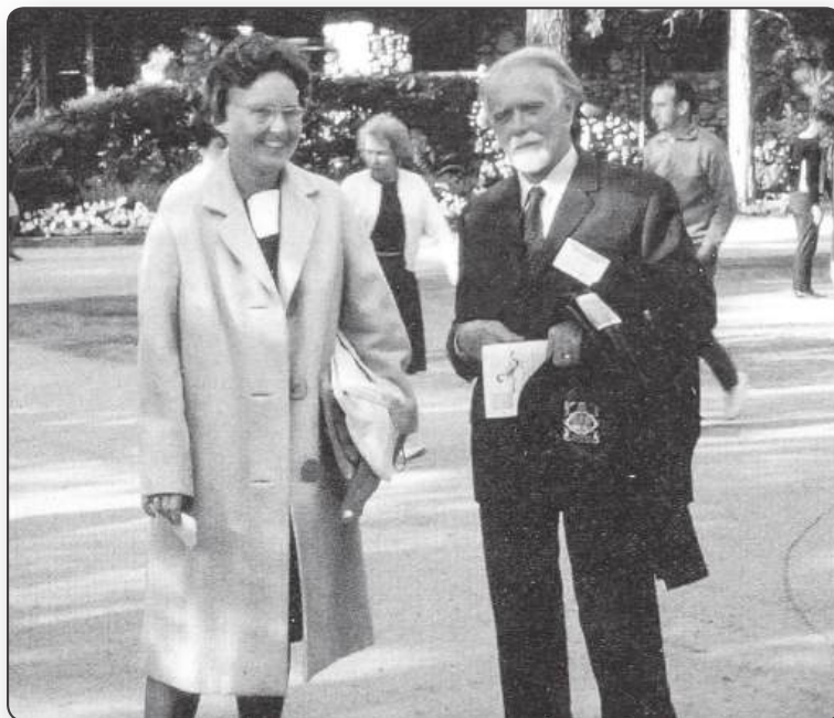
Kodály Zoltán és Szőnyi Erzsébet Stanfordban

levelet, ő fölvette - és abban volt az ISME igazgatósági tagok névsora és címe. Ezzel kezdődött a kapcsolat, nyitás a nagyvilág felé. 1961-ben kapta a meghívást a bécsi ISME konferenciára, amikor más országok zenei nevelési problémáiról is értesülhetett. Ezt követően főként a Nemzetközi Zenei Nevelési Társaság, az ISME szervezésében került sor a külföldi utakra, amikor a nemzetközi konferenciákon mindig a magyar zeneoktatásról tartott előadást. 1965-ben meghívták tengeren túlra is. Majd hosszabb előadássorozat tartására kérték fel. Hamarosan rendszeressé váltak a tengerentúli és európai meghívások. Útjai elvitték Japánba, Kanadába, Amerikába, Ausztráliába. Jelentős volt szakmai szereplése az 1966-ban rendezett amerikai Interlochenben rendezett ISME Fórumon és azt követte a kaliforniai Stanford Egyetem, ahol Kodály Zoltánhoz csatlakozva mindketten tartottak előadásokat. E nagyhatású előadások indították el, hogy különböző államokban létrejött szervezetek rendeztek konferenciákat.