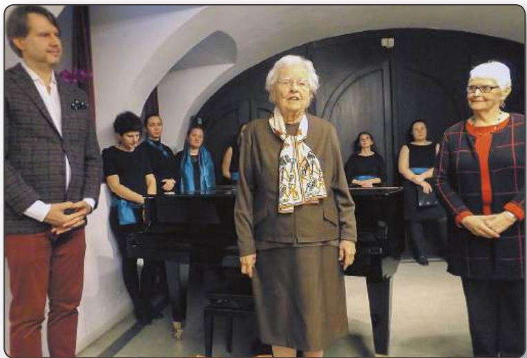
A Kodály Zoltán Emlékmúzeumban