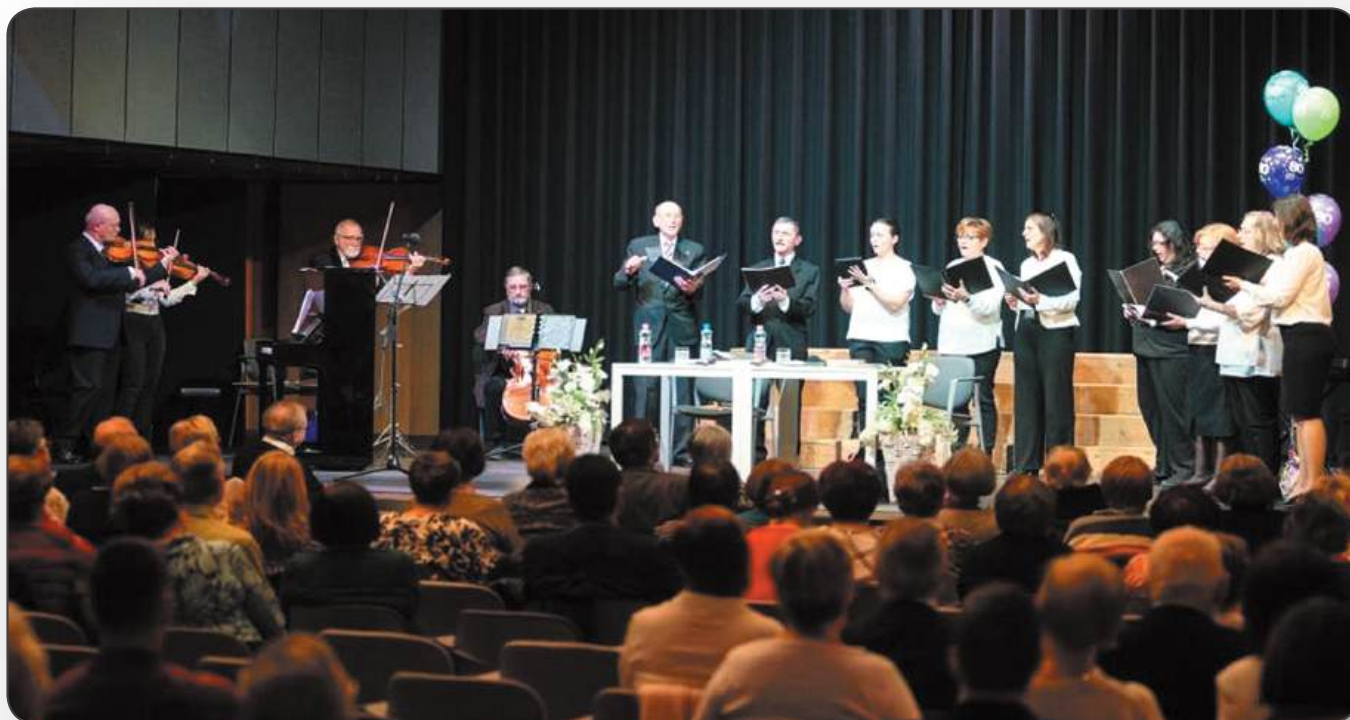
A Keresztény Értelmiségiek Szövetsége szegedi kórusa vezetőjeként, a kórust kísérő kamaragyüttesel