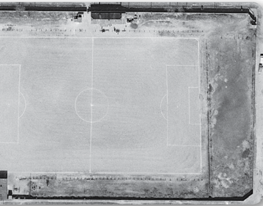
WSC telep 1964. 02. 15-én