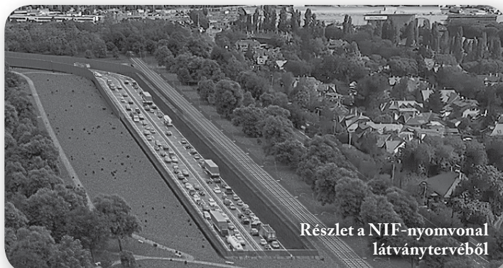
Részlet a NIF-nyomvonal látványtervéből

A Határ úti Kiserdőt, illetve a Galvani-híd (új Duna-híd) állami gigaberuházás megépítéséhez kapcsolódó útvonaltervet, melyek a nagyjából 22 hektárnyi területet Kiserdő-üggé emelték, nem kell bemutatnunk. Két éve zajlik már ez az ügy, ez idő alatt kialakult a Kiserdővédők nevű lakossági csoportunk. Érdekes áttekintésünk, hogy hol áll most a Kiserdő-ügy, hiszen a naprakész hírekről csak azok értesülnek, akik rendszeres követői csoportunk közösségi oldalainak, vagy legutóbb, július 16-27. között személyesen találkoztak velünk, valamelyik kispesti és József Attila-lakótelepi kitelepüléseink egyikén.