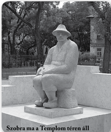
Szobra ma a Templom téren áll

1895-97-ben a Fővárosi Iparrajziskolán, '98-99-ben az Iparművészeti Iskola esti tanfolyamán neves tanároknál, köztük Ferenczy Károlynál csiszolta tudását. A rákövetkező évben Münchenbe ment, ahol több festőiskolát látogatott, köztük az Akadémiát. Ahogy itthon is, úgy Münchenben is a legszűkösebben élt.