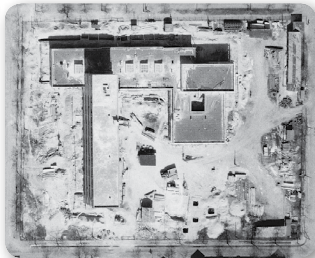
A gimnázium építkezése 1964. 02. 15-én