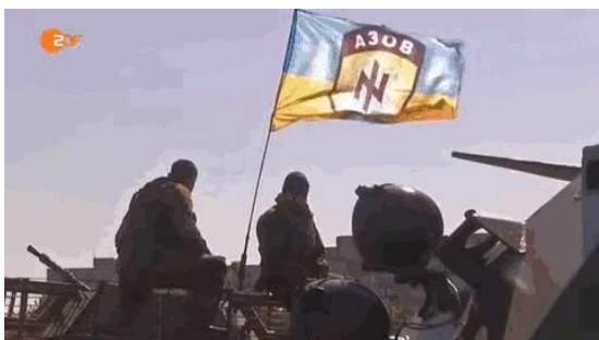
A kép a ZDF televízió 2014. szeptember 8-i, 18 perces tudósításából való

Elsősorban éppen az a fenyegetés váltotta ki a konfliktust, hogy – az ukrainai többség és akkori választott kormánya ellenzése ellenére – Ukrajnát egy Oroszországgal szemben ellenséges katonai szövetségbe akarták bevonni. A béke fenntartása helyett a NATO maga az oka a feszültség és a háború fokozódásának. Mindig így volt ez amióta a NATO-t 1949-ben, a hidegháború tetőpontján, hat évvel a Varsói szerződés előtt megalapították, állítólagos védelmi szerződés-ként a szovjet fenyegetés ellen. Gyakran állítják, hogy ez a szövetség tartotta fenn 40 éven át Európában a