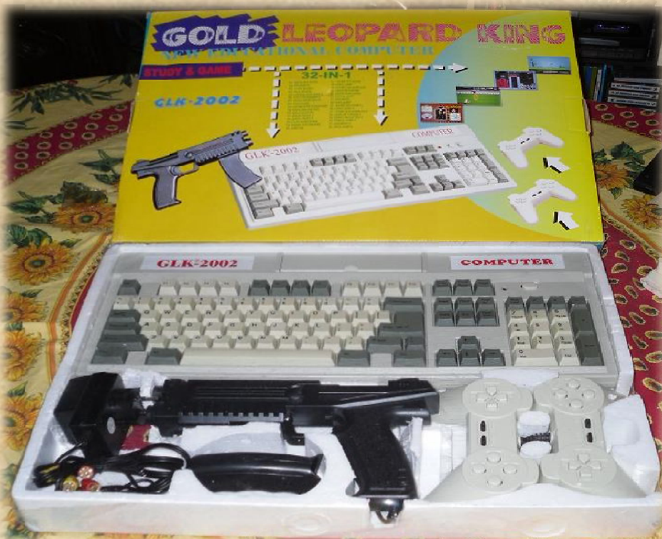
Készítette: Pénzes Martin

Egy konzolról van szó tehát, tévére csatlakoztatva játszhattunk vele. Minden piac, és játékbolt tele volt azokkal a bizonyos sárga kazettákkal. Ezeken volt rajta egy játék, vagy játékok. Persze elég gyakran jó nagy átverésekről volt szó. Más a matrica a kazettán, mint a játék, nem a kódok, stb. Általában lehetett ilyenkor cserélni egyet. Másik szépség az volt (és ezt a Tetris-szel is gyakran eljátszották), amikor ráírták: 999, vagy 1988, stb. játék (van a kazettán), ami persze kamu. Volt rajta mondjuk 10 játék, csak a sebesség, játékosok száma, stb. variálásával jöhetett ki 999 játék. Nekem amúgy elég sok gondom volt a kazettákkal. Valamikor általános iskola végén kaptunk öcsémrel egy ilyen masinát karácsonyra. Addig csak haveroknál játszottunk vele. Elég jól nézett ki, annak ellenére, hogy nem a két nagy gyártó egyikétől származott (eredeti hamisítvány). A neve is ütős volt: Gold Leopard King 2002. Volt hozzá minden ami kellett, és az egyszerű fekete doboz helyett, egy klaviatúra volt a "gépház". Nem maradhatott el mellette a pisztoly sem. Tehát a gond a kazettákkal, meg a nem túl eredeti hardverrel. Bizonyos kazetták, amik mondjuk a Sega konzoljain gond nélkül futottak, nálunk semmiért sem voltak hajlandóak. Nem baj, volt így is elég kaland.