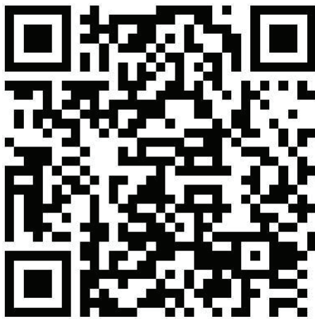
A húsvéti ünnepkör református hagyománya