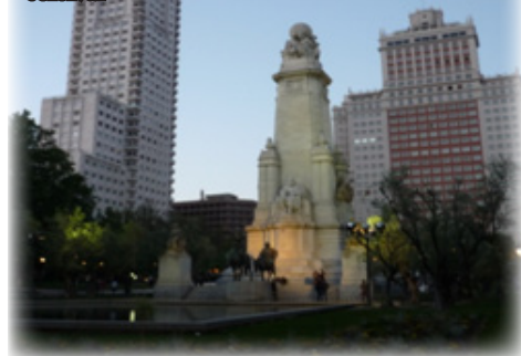
Plaza de España –hátterben a Gran vía felhőkarcolóival

Tudom, itt sincs tejföl és túrórudi. Illetve tejföl van, de az orosz élelmiszerüzletben vásárolható nem az igazi. Akkor mi mást egyél? Paella-t, aminek helyből legalább hat változatát kóstolhatod az éttermekben, de nekem még mindig egy kicsit húsos rizs az egész. Kóstolj gazpacho -t, hideg zöldségleves gyanánt; churros -t, ami forró csokiba mártott tömény fánk-élvezet; tengerit, ha bírod; tézstasalátát, mert az a sztenderd ebédmenü. Vasárnap, az El Rastro bolhapiacról hazajöve térj be egy tapasbárba és kérj egy tortilla de patatas -t (gyakorlatilag krumplis rántotta) és utána dobd a szalvétát a pult elé, a földre – a szalvétahegyek az elégedett vendégek nyomát mutatják a büszke vendéglős bárjában. Igyál Schweppes-et,