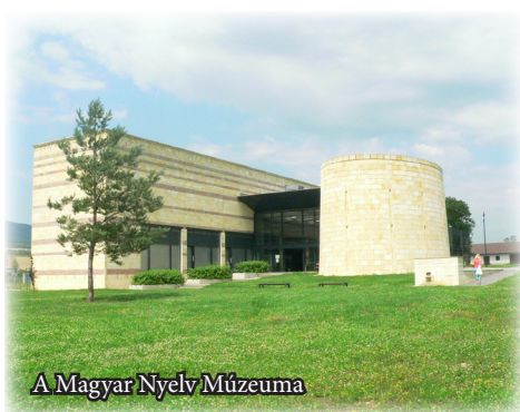
A Magyar Nyelv Múzeuma

A múzeum szomszédságában, pontosabban a palota egy másik részében található az elegáns Károlyi Étterem és Kávéház. Erről véleményt mondani sajnos nem tudok, az árakat ott nem a szocitamból és tanulmányi ösztöndíj-