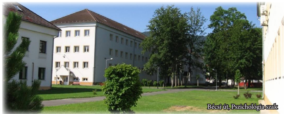
Bécsi út, Pszichológia szak