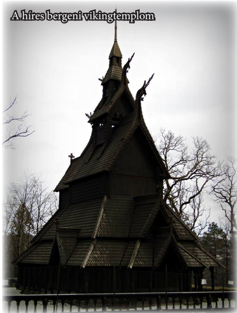
A híres bergeni vikingtemplom