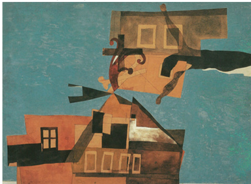
Korniss Dezső, Szentendrei motívum II., 1948