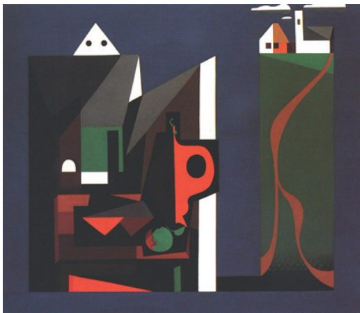
Bálint Endre, Szentendrei ház, 1948