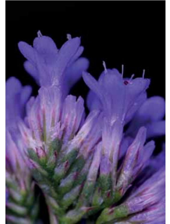
A SÓVIRÁG LILA PÁRTÁJA és hártás murvalevelei